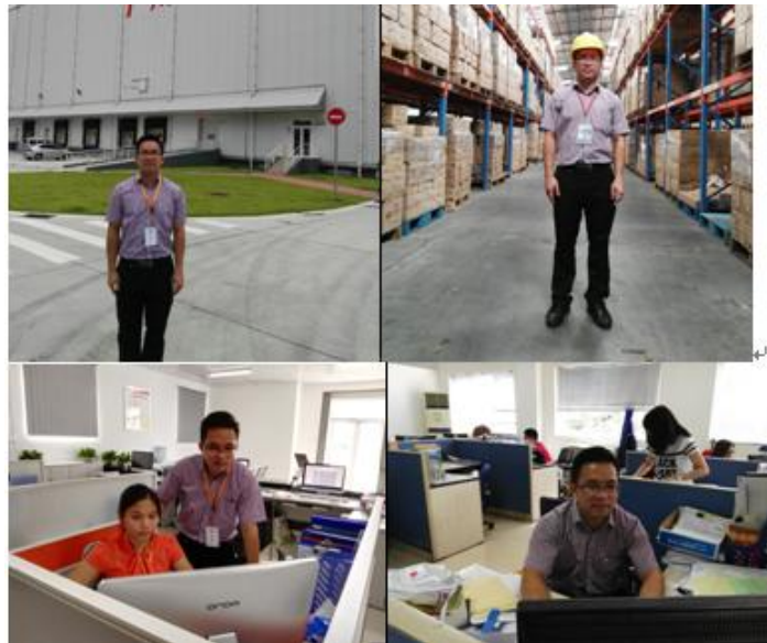
图 2 省级师资培训项目在长运开展

作为一家国企，广州长运冷链服务有限公司不仅承担物流生产和服务等经营职能，还承担着培养人、发展人和成就人的社会职责。公司支持包括广东交通职业技术学院等多家院校开展校外实践教学和青年教师技能培养等工作，联合申报并实施省培项目 2 项，参与国培项目研发 1 项。