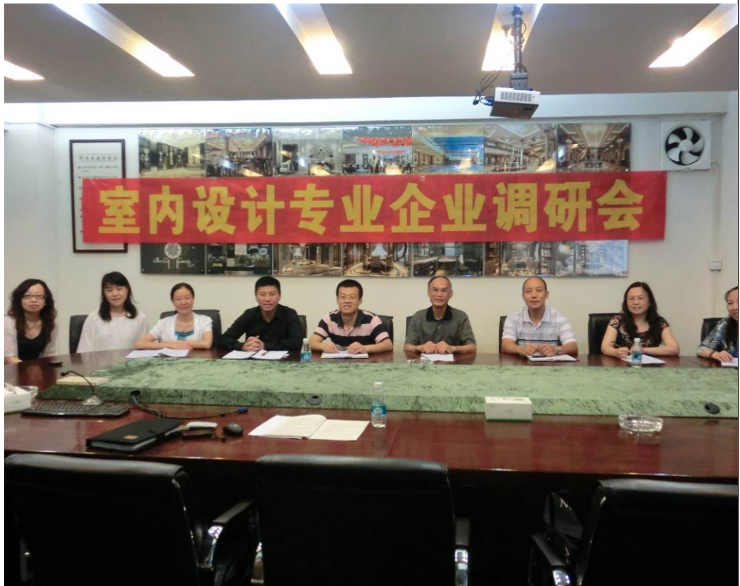
图 3：学院专业教师与景龙公司座谈调研