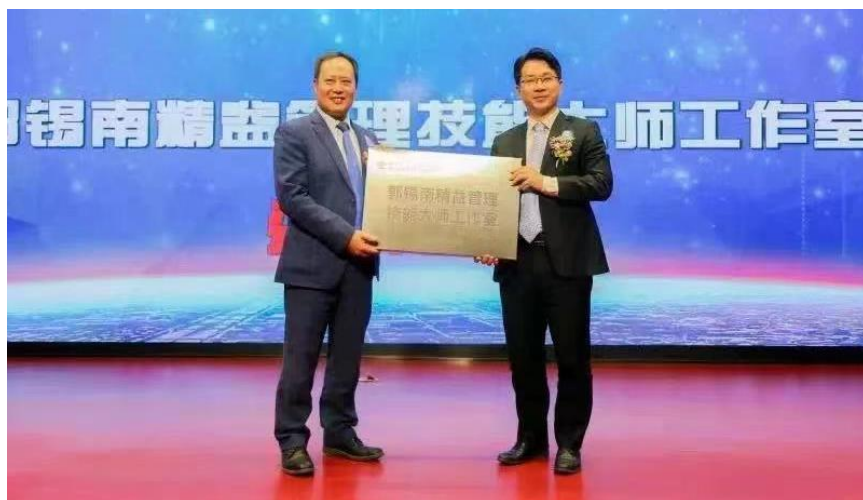
图2 “顺德职院”邀请“乐善公司”精益管理专家成立技能大师工作室