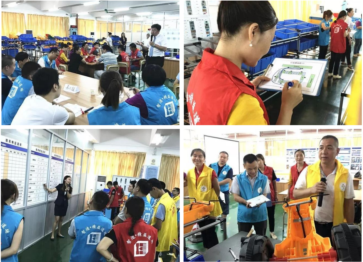
图6 依托“智造·精益道场”培训平台开展精益生产管理