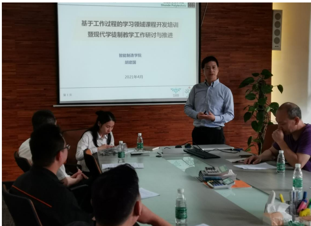
图4 “顺德职院”为“乐善公司”内部讲师开展“送教上门”