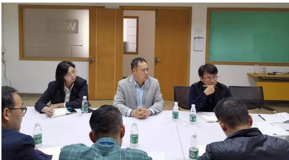
图9 精益生产管理教学团队在广东韦博净水科技有限公司开展咨询服务