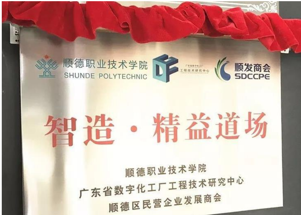
图3 集聚资源共筑“智造·精益道场”培训平台