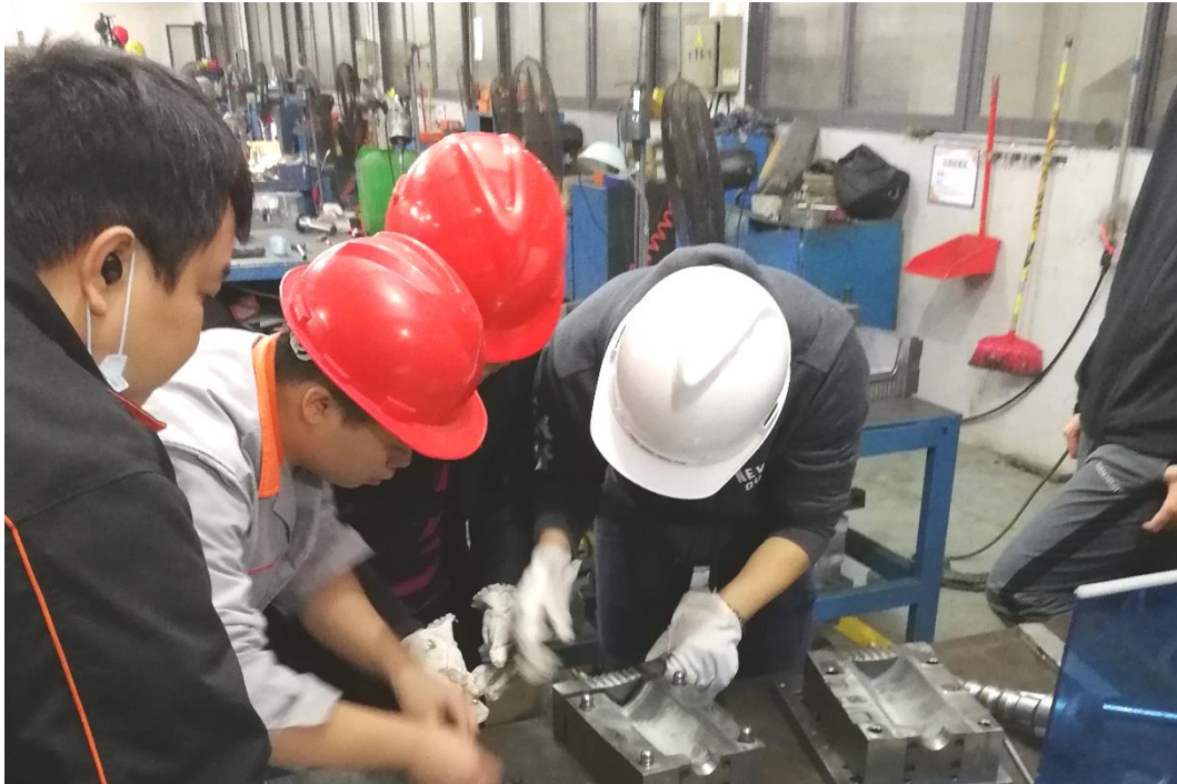
图 5 现代学徒制在岗学员在完成模具拆装典型工作任务