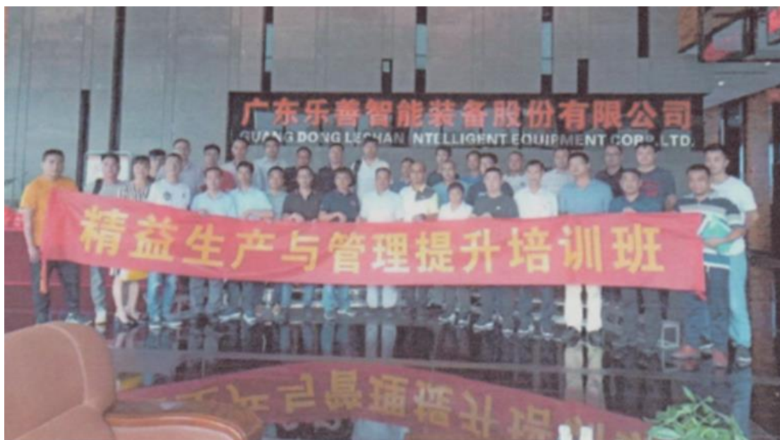
图8 精益生产管理培训学员赴乐善公司现场参观交流