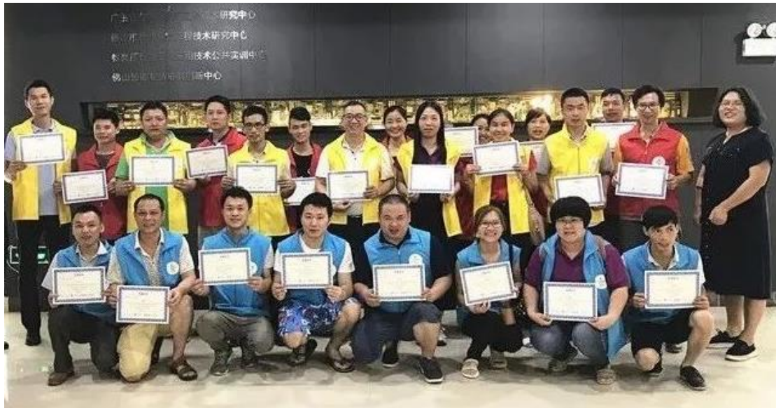
图7 精益生产管理培训学员获得结业证书