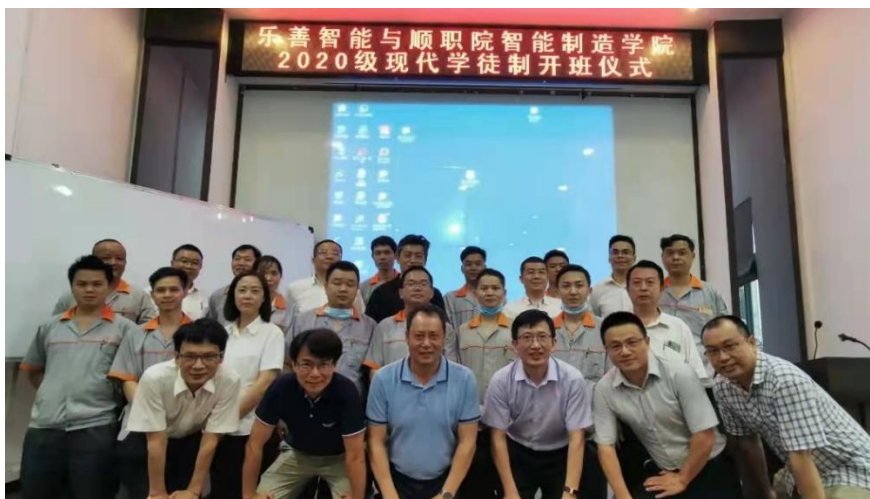
图1 “顺德职院”与“乐善公司”合作开展现代学徒制人才培养

乐善公司技术与专家担任我校智能制造类专业建设委员会委员，参与制订相关的人才培养方案；积极基于工作过程的学习领域课程开发和行动导向教学法培训，共同开发现代学徒制和新型学徒制试点班的个性化专业课程，例如《吹塑设备工作原理及应用》、《吹塑设备机械部件装调》、《吹塑设备液气系统装调》、《吹塑设备电气系统连接》、《吹塑设备联机调试》、《吹塑模具拆装》、《吹塑设备安全操作》、《吹塑设备保养与维修》等，以及共同制订《精益生产管理》课程标准；指导我校建设“智造·精益道场”和“精益生产管理特训营”训练基地；依托“郭锡南精益管理技能大师工作室”，为我校《精益生产管理》课程团队开展师资培训，并主导现代学徒制和新型学徒制试点班专业课教学工作。