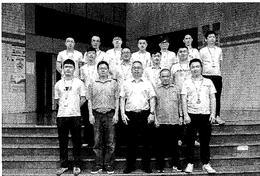
图 3 美团无人车配送业务骨干培训