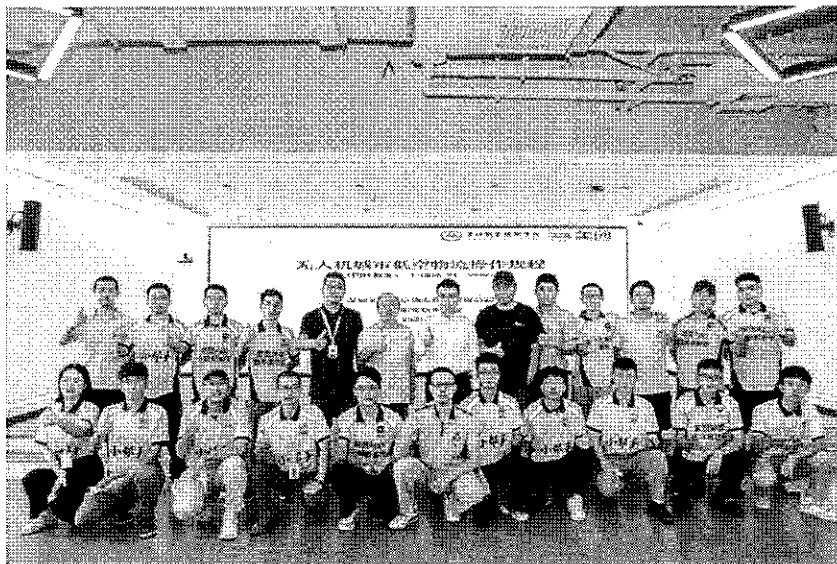
图 2 美团无人机配送业务骨干培训

程遥控、车辆运维、应急处置等系统知识与技能。后期这批员工，在深圳的多个社区、商场、写字楼的智慧园区开展无人车物流配送的相关业务。