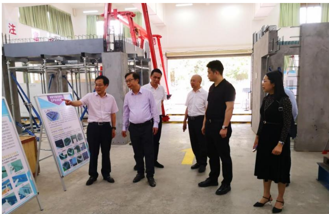
图 5：装配式建筑实训基地

4、广东永和建设集团有限公司共建装配式实训室合同（包含装配式建筑实训基地设备）。