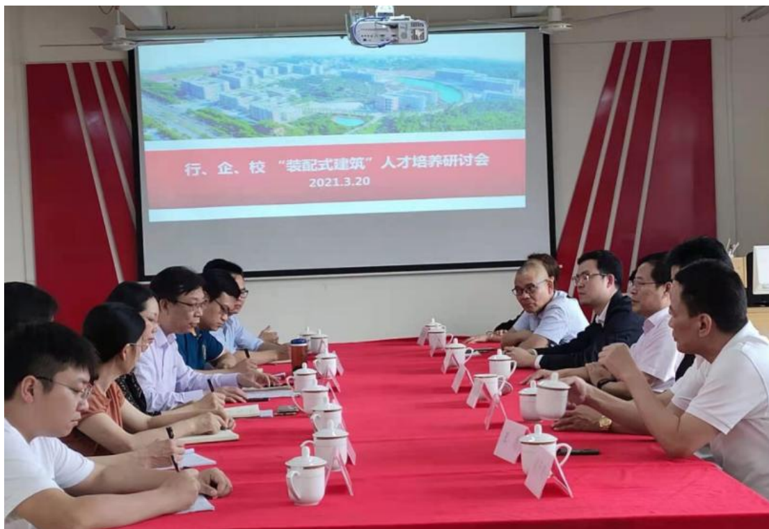
图 4：装配式建筑人才培养研讨会

4、广东永和建设集团有限公司共建装配式实训室合同（包含装配式建筑实训基地设备）。