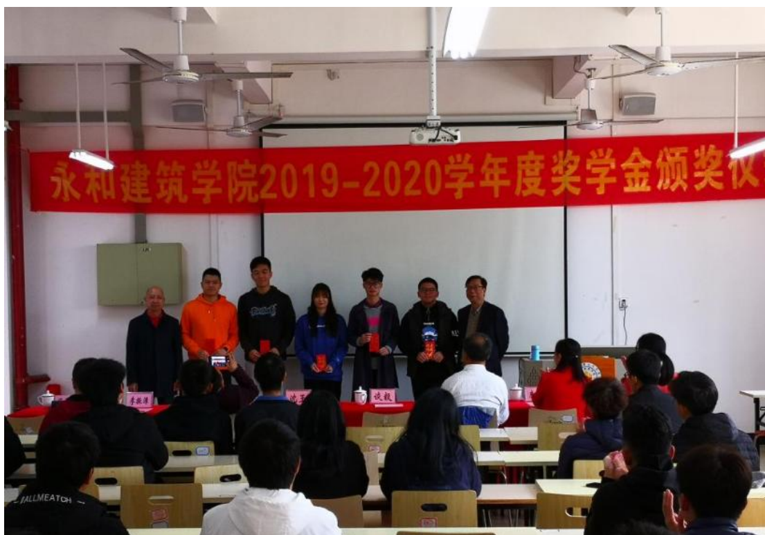
图 7：永和奖学金发放