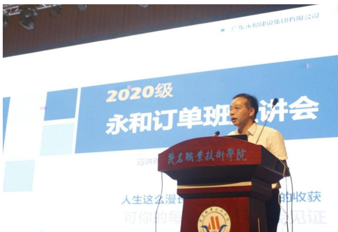
图 6：永和订单班宣讲

共同制定订单班人才培养方案，企业先后派出 14 名专业业务骨干人员送教到校。报读永和订单班的人数逐年增加，每年报读人数超过 100 人，通过企业的筛选，目前在校订单班人数为 147 人（其中 2017 级 75 人，2018 级 58 人，2019 级 41 人，2020 级 59 人，2021 级 47 人）。通过订单班的形式共育人才的专业包括：建筑工程技术、建设工程管理、建筑设计、建筑室内设计、工程造价、道路桥梁工程技术。