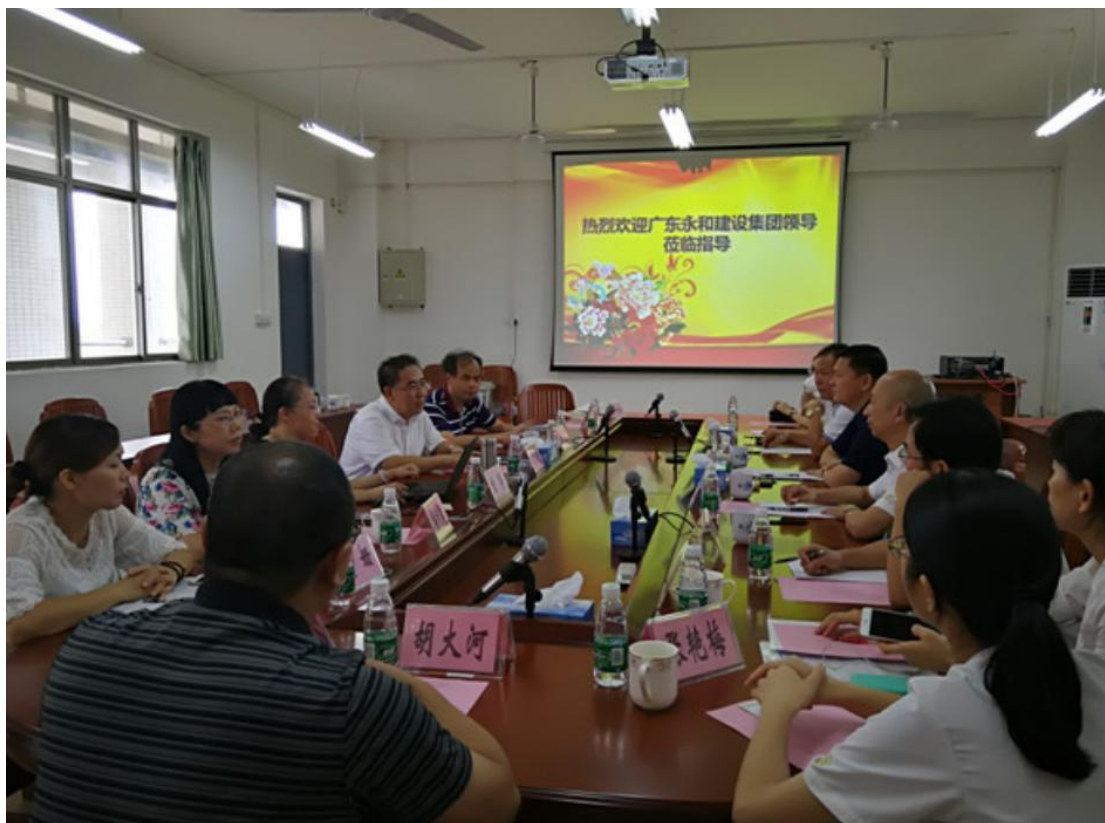
图 8：校企合作周年回顾和展望工作交流会