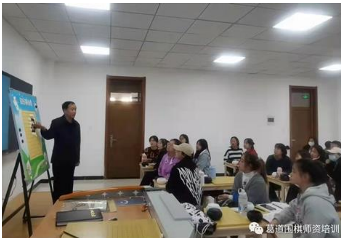
图4 开展“双证融通”围棋师资培养