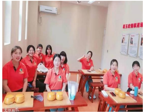
图5 围棋师资班学生实岗轮训