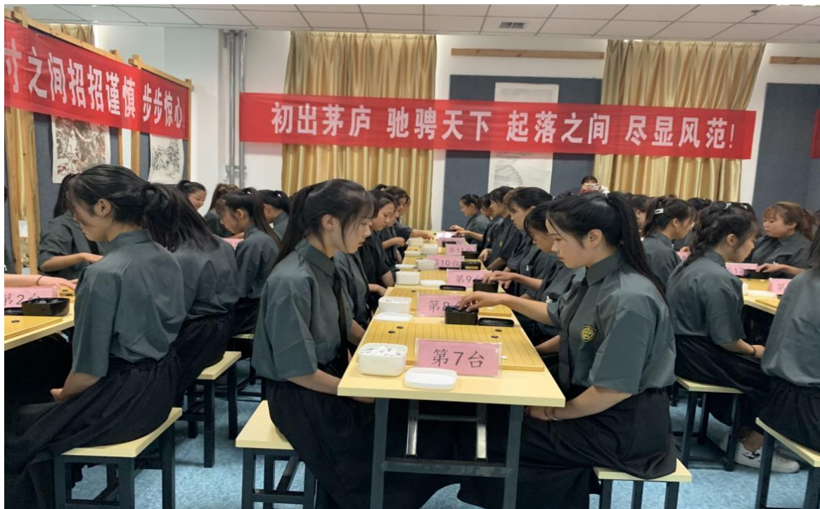
图 10 围棋比赛

为了拓展学生技能，积极开展“1+X”证书试点，让学生在获取“幼儿围棋教练”证书和业余围棋段位、级别证书的基础上，并考取“1+X”幼儿照护证书，使学生具备多项职业能力。