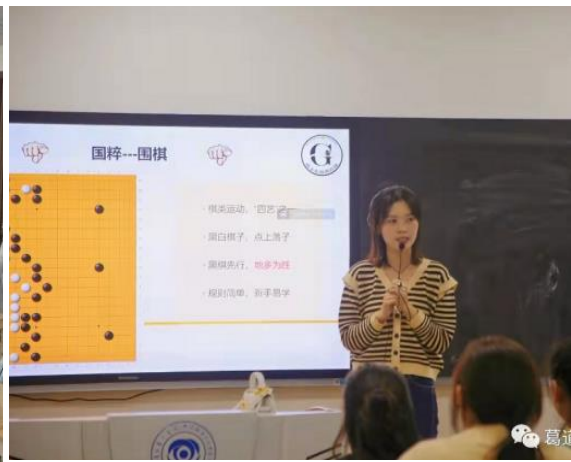
图6 “工作室”化课程教学