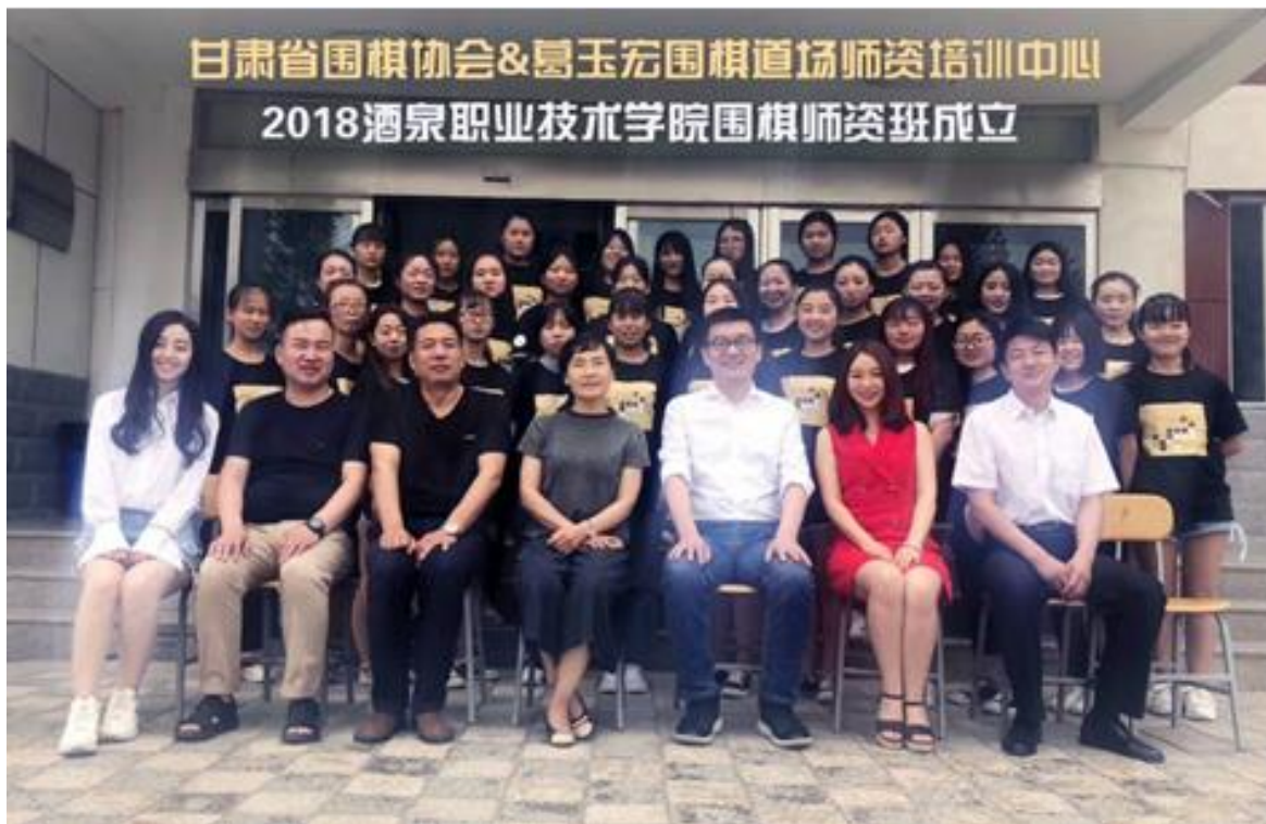
图3 成立现代学徒制围棋师资班