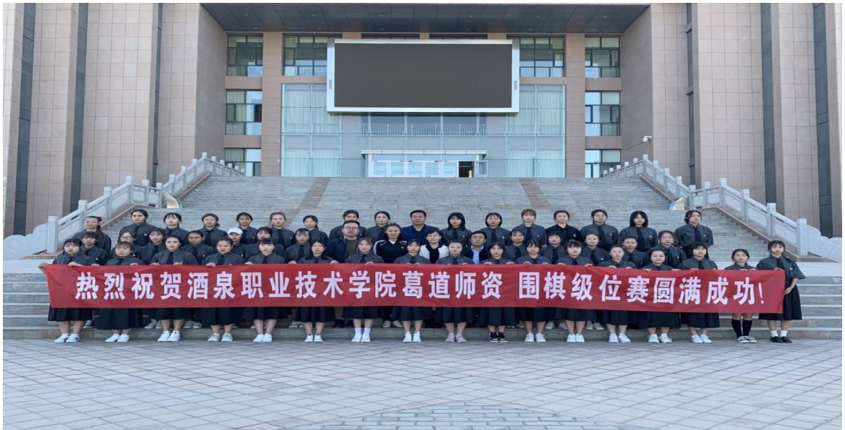
图 11 围棋师资班