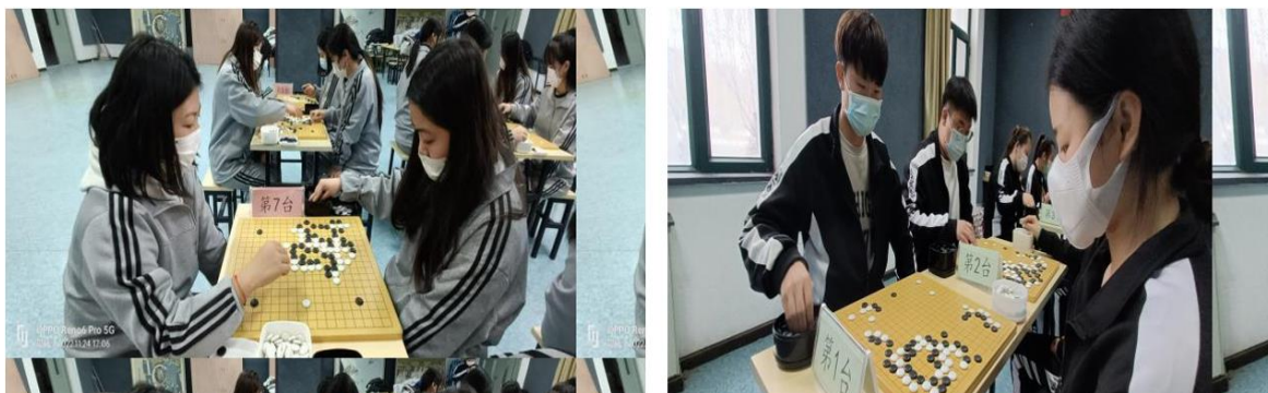
图 2 围棋实训

核与职业资格证书考核相一致；开发了基于项目的优质特色教材 3 余部，实训指导书 5 余部，促进了教学改革纵向发展。