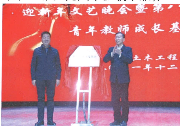
图2 教师企业实践基地揭牌图

业进行单项技能实践。校企共同制定“学徒实习计划”，企业安排学徒实习内容、考核方式，学校安排骨干教师到企业既挂职锻炼，又以“指导师傅”的身份协助学徒管理。2022年聘用10名企业管理人员参与校内常规教学，聘请20余名优秀项目经理作为企业师傅，建设企业教师实践基地1个，专家工作站1个，范生军工作室1个，共有8名教师进行了实践锻炼，专家工作站和工作室完成学生教学服务144学时。