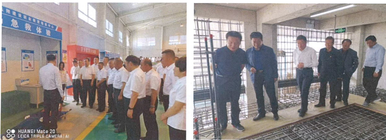
图 7 共享型实训基地

工程质量检测中心，面向学校全天候免费开放进行实训教学，每年开放 10 余个标准化工地为学生提供见习实习和岗位实习，建成集学生实习和企业员工继续教育的共享性实训基地。2021 年完成我校 300 余人安全教育课程教学和 600 余人次现场实践教学。