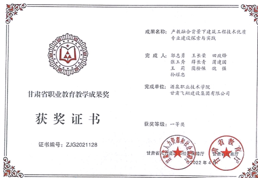
图 10 甘肃省教学成果奖证书