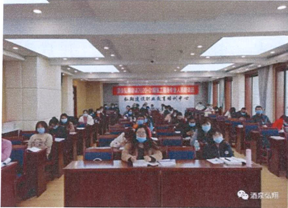
图 14 施工现场作业人员培训