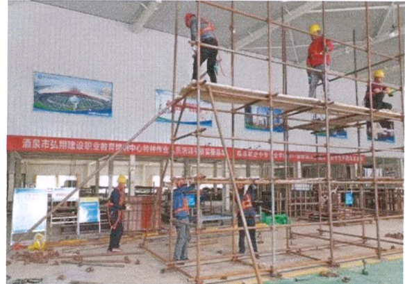
图 15 架子工培训