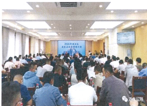
图 12 建造师培训

每年完成建筑业技能鉴定 600 人次、企业员工培训 1000 余人次；校企开展酒泉市现役农村民居的抗震性能评估、酒泉地区框架填充墙温度裂缝的防治研究和基于“三生”融合的乡村振兴规划研究等项目，联合开展以技术开发、技术咨询、技术服务、技术转让为重点的“四技服务”，为本地区美丽乡村建设和棚户区改造提供设计方案和施工指导。