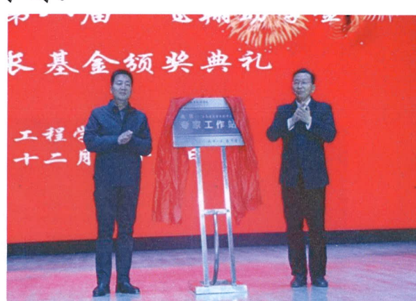
图3 专家工作站揭牌