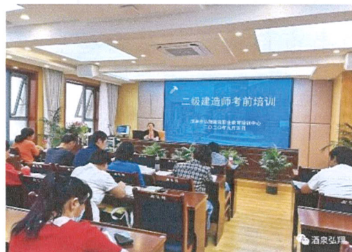
图 13 酒泉市肃州区建筑安全培训