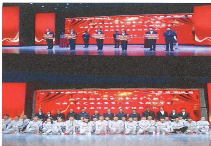
图 8 第八届飞翔成才奖发放仪式

设立“飞翔助学金”、“飞翔青年教师成长基金”，2021 年捐资 4 万元，助推优秀贫困学生学业完成，青年教师提高岗位技能和科研水平。