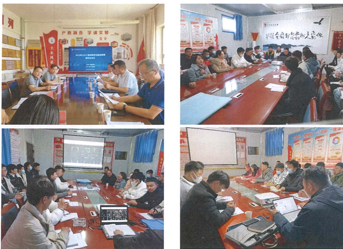
图1 学训交替企业实践教学

实训)的教学组织形式,学生每周安排4天在校内学习专业基础课程,安排1天到校内外实训基地进行单项技能的实践训练,第四学期在校内完成岗位基础能力训练后依托工程项目进入企业进行跟岗实习;第五学期采用“4+1”(4周理论学习+1周项目实训)的教学组织形式,学生安排4周在校内进行项目化学习,安排1周到校外实训基地进行模块化岗位核心能力训练。第六学期在企业进行顶岗实习。2022年企业承担学训交替12次,共计600余人次,接受岗位实习学生36人。