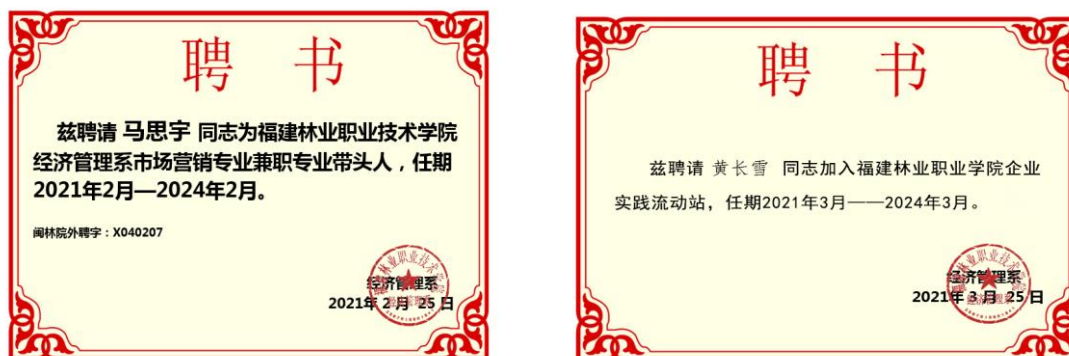
图 2 聘请企业行业专家马思宇、黄长雪

贸专业群相关专业课程的兼职教师与兼职专业带头人，承担课程教学任务，指导提升年轻教师专业职业岗位能力和实践教学能力，满足电子商务行业、企业对高素质技术技能人才的需求。他们积极参与专业群人才培养模式改革、校企协同育人、课程建设、教材开发、师资队伍建设、实训基地建设、服务能力建设，校企共同申报课题，协同开展技术攻关，协同指导、管理和评价学生的实践活动，协同开展合作育人、“双师培养”，为提高人才培养质量奠定了坚实的基础，实现互利共赢。