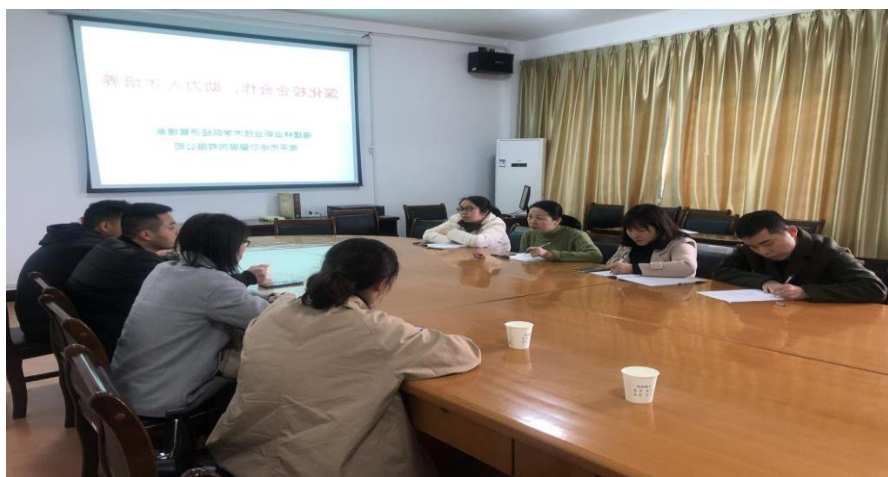
图1 与福建南平市依尔婴服饰有限公司达成校企合作意向

校企双方共建优化了行业特色专业、共建先进实习实训基地、共同开发核心课程、共培新型双师队伍、共育技术技能人才、共同开展应用技术研究、共享人才资源，实现资源共享、基地共用、人才共育、风险共担、利益共享、互利共赢。通过多年的合作，福建林业职业技术学院和福建南平市依尔婴服饰有限公司共同搭建的产学研一体化发展生态圈，打通了企业专家和学校教师的人才交流通道，优化提升了专业教学的质量，进而提高了人才培养的质量，为服务区域经济发展、助力乡村振兴输送了优秀人才。