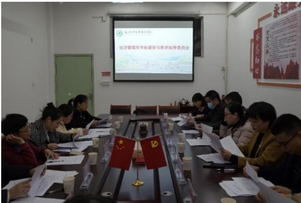
图5 校企共同研讨制定人才培养方案