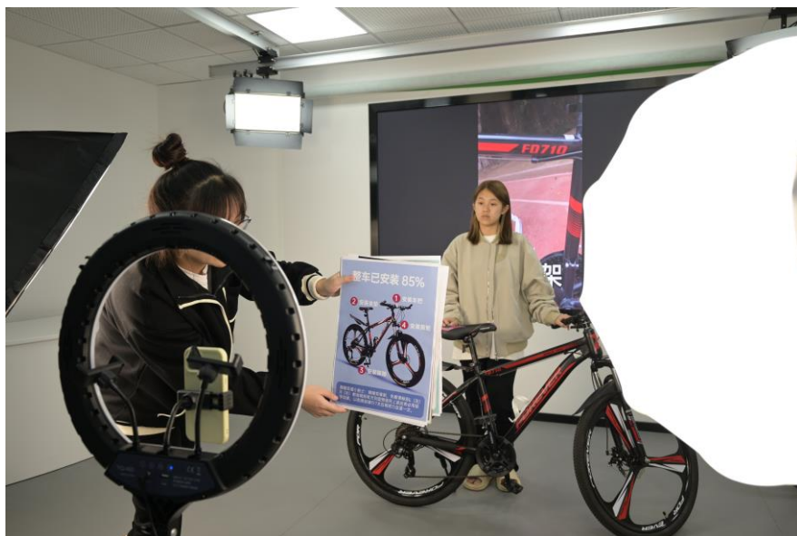
图 10 企业行业导师到校指导学生实训

量共评”的运行模式。把企业工作任务融入到教学内容，把生产基地当课堂，在完成生产任务的过程，介绍相关的必需知识，突出知识的实用性和针对性，将知识传授与技能培养有机组合。在真实生产环境中，由行业企业专家一对一指导学生规范完成电子商务运营，让学生及时了解和接收了前沿的电商实战经验和技能，实现“学中做、做中学”，进一步增强电商职业素养，满足企业用人需求，实现校企合作，共育技术技能人才。