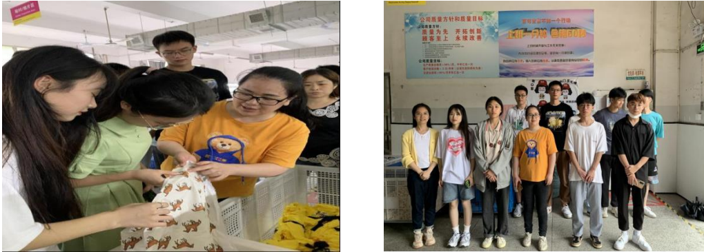
图6 学生到企业共建实习实训基地接受企业导师指导