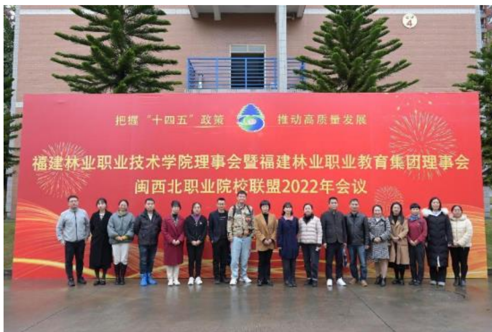
图4 共建校企合作协同育人机制，打造产学研一体化生态圈