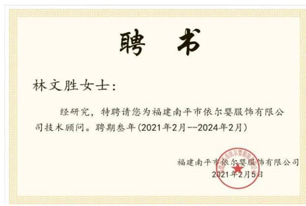
图 9 企业聘请我院林文胜老师担任技术顾问

（科技特派员创新创业大赛项目）——《智慧生产协同系统开发与推广应用》，协同攻克企业难题，进一步将产学研成果真实落地。我院老师与企业合作立项 2022 年省中青年教师教育科研项目（社科类）——《三农直播对闽北地区数字经济发展的影响研究》，以课题研究带动更多师生和企业员工投身科技创新与市场调查研究，提升解决区域产业生产难题的能力。