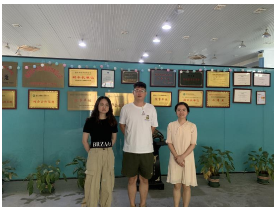
图7 教师下企业实践与教学