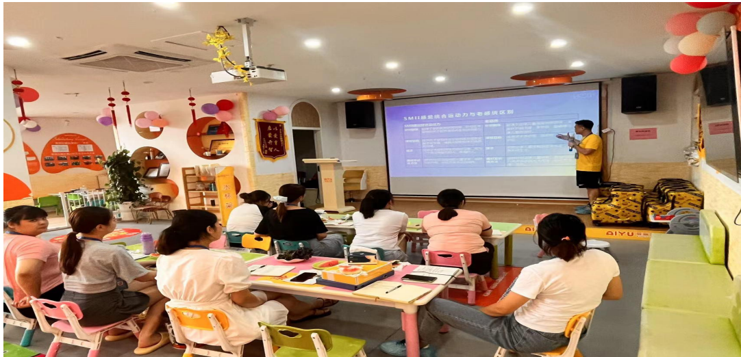
图 4-6：短期实习需同企业教师一同参与企业培训