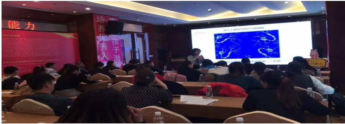
图 1-6: 校区资深教师受邀赴青海开展家庭教育讲座