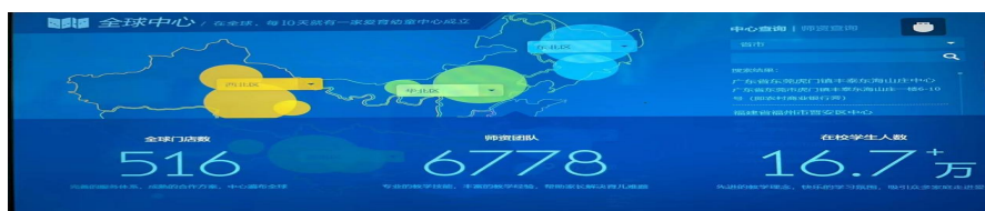
图 1-1：爱育幼童全球中心师资、学员等情况（动态数据）

给孩子》被列入全国中小学图书馆配书目录；成为国家关工委组织“百城万婴”成长指导计划战略合作伙伴；荣获新浪教育评选品牌影响力儿童教育机构；中国关心下一代工作委员会颁发——百城万婴专家聘书。2013年，于香港创立国际儿童全脑潜能研究会、国际家庭教育研究会。2014年，推出首部公益微电影《赋予孩子幸福的能力》；爱育专家著书《把右脑还给孩子》获第三届中国大学出版社“优秀畅销书奖”；爱育幼童首席专家受邀出席中国教育行业创新与发展高峰论坛；获选腾讯“回响中国”颁发影响力教育品牌。2015年，爱育幼童推出广告产品宣传片及第二部公益微电影《我们》；爱育幼童官网及品牌终端形象系统 SIS 全面升级；首批爱育幼童讲师团成立，将把爱育理念带给中国万千家庭。2016年，荣获腾讯“回响中国”年度家长信赖教育品牌；爱育幼童推出第三部公益微电影《我们-孩子篇》；爱育旗下语言智慧课程“语言佳”正式发布；爱育幼童 OA 系统正式上线运行。2017年，荣获腾讯“回响中国”影响力儿童教育品牌；爱育幼童与招商银行 IC 联名卡发行；设立爱育专属奖项——“金育奖”；爱育企业大学正式成立；爱育“天育计划”正式发布；爱育旗下 7-12 岁全脑课程“全脑佳”正式发布；爱育幼童公众号【晚听】栏目成立。2018年，荣获腾讯回响中国年度社会影响力儿童教育品牌。2019年，组织举办中英教育 CPD 专项研讨会暨爱育幼童全脑教育 CPD 证书实训营。2020年，爱育幼童云课线上课程（灯塔计划）成功上线。2021年，爱育幼童体智优+课程全新升级。爱育幼童教育集团分部（课程服务中心）在中国大陆迅速发展达 500 余家。