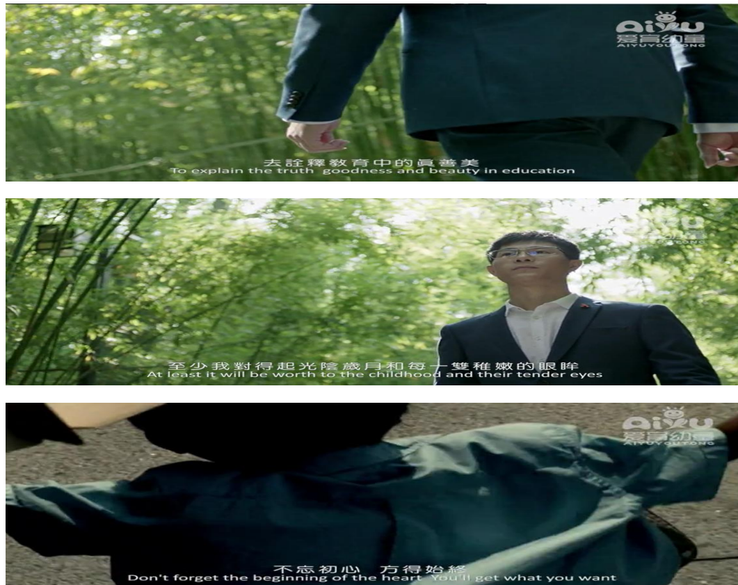
图 4-5: 企业微电影展示企业文化

承担学生专业认知活动、优化见习内容。改变以往“走马观花”式的专业认知活动,而是通过企业文化宣导、专业发展前景数据分析、专业能力发展规划指导、全员分组分项体验“四个维度”帮助学生真正认知专业发展、进一步建立职业认同感和职业信仰。