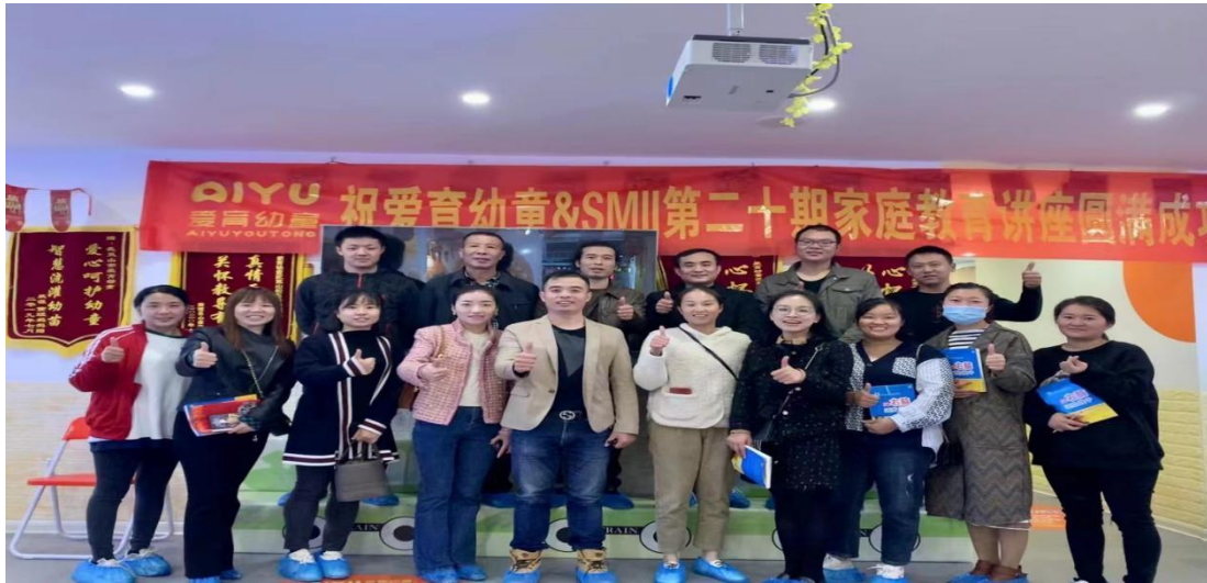
图 1-3: 武夷山爱育幼童教育咨询有限公司服务社区家庭教育讲座现场