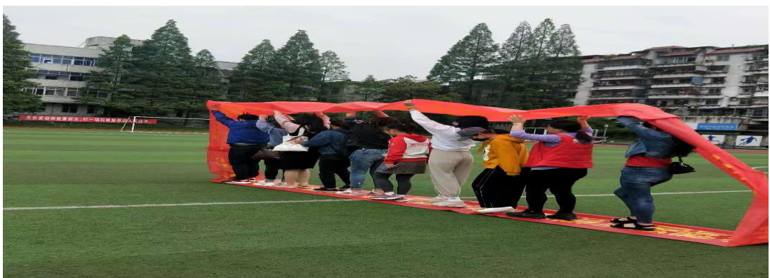
图 4-7：武职院顶岗实习学生融入企业团队（团建活动）

顶岗实习基地联动，保持同学校之间的交流与沟通：顶岗实习仍属于教学（人才培养）环节，重心在于实习生的实践能力培养。因此顶岗实习企业同学校互联互通，就顶岗实习任务目标、具体任务内容达成一致。一方面在不违背实习目标任务的前提下，丰富实习岗位，拓宽岗位领域，拓展就业渠道；另一方面校企联动，构建顶岗实习机制，明确校企双方在顶岗实习过程中的责任和义务，确保顶岗实习工作保持高效、有序的运作态势。