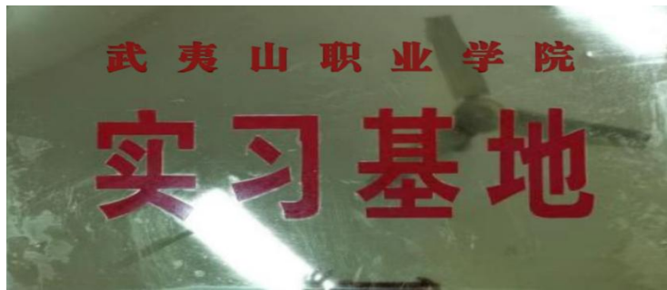
图 2-1：武夷山爱育幼童教育咨询有限公司被授予“武夷山职业学院教育实习基地”

教育实习基地是提供给学生从理论知识向实践能力转换及学校师资实施教科研、积累企业工作经验的重要场所。为了培养理论与实践相结合的表演艺术（幼儿方向）的优秀人才，且根据现有幼儿教师的学历要求和就业形势，需寻求特色培养之路。基于此，武夷山职业学院对爱育幼童的办学理念、队伍建设、发展前景等方面进行了全面考察，在前期多次交流研讨，达成统一共识后，将爱育幼童武夷山校区定为武夷山职业学院“教育实习基地”。2020年9月25日，在武夷山爱育幼童教育咨询有限公司举办了“教育实习基地”授牌仪式。