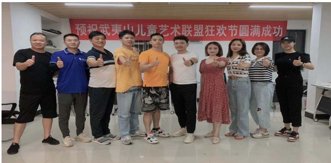
图 1-4: 2021 年武夷山儿童教育联盟交流成员合影留念