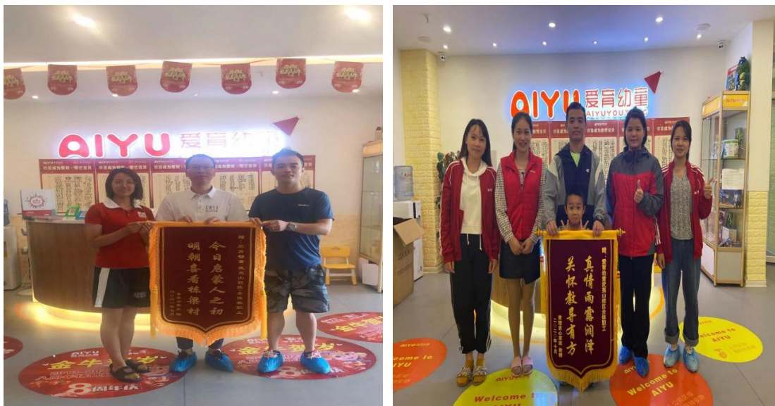
图 1-5: 收获家长口碑与赞誉