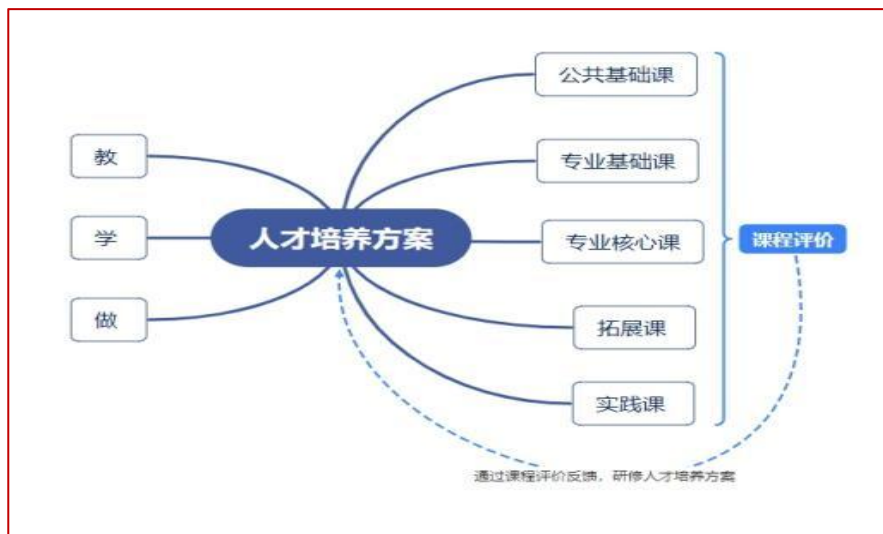
图 4-1：人才培养方案制定工作流程图

爱育幼童武夷山校区和武职院通过召开三次专业建设研讨会，共同修订校企合作专业人才培养方案，建立完善了总课时在 2600 学时左右的“公共基础课模块+专业基础课模块+专业核心课模块+职业拓展课模块+实践课模块”人才培养课程体系。在学校“公共基础课+专业基础课程+部分专业核心课”的基础上，企业提供特色专业核心课程、拓展课程与实践模块。