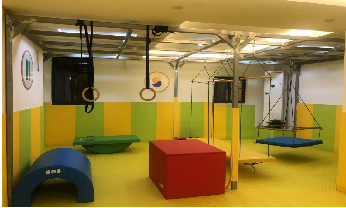
图 4-4: 新扩建的感统训练区 (局部空间)

序开展，武夷山爱育幼童教育咨询有限公司加大了对校区的扩建和改造力度，加大针对于校企共建职业拓展课《感统训练课》的功能设施建设。现爱育幼童校区拥有大型室内活动室、感统训练区，配套设施齐全，能满足校企合作专业实践教学和实训需要。