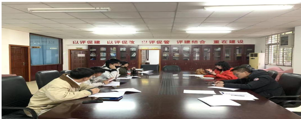
图 4-3: 受邀到武职院参加教学评价会

3. 推进课程评价开放化。学生专业学习成效，无论是企业导师承接课程，还是校内教师承接课程，都积极推进课程评价开放化。即专业核心课课程成效，除进行校内评价外，还引入企业评价，以行业视角参与教学成效评估。课程教学成效评价体系的开放化，有助于帮助校内教师换位行业人才需求视角进行课程反思、再设计，有效地推动教学改革工作。