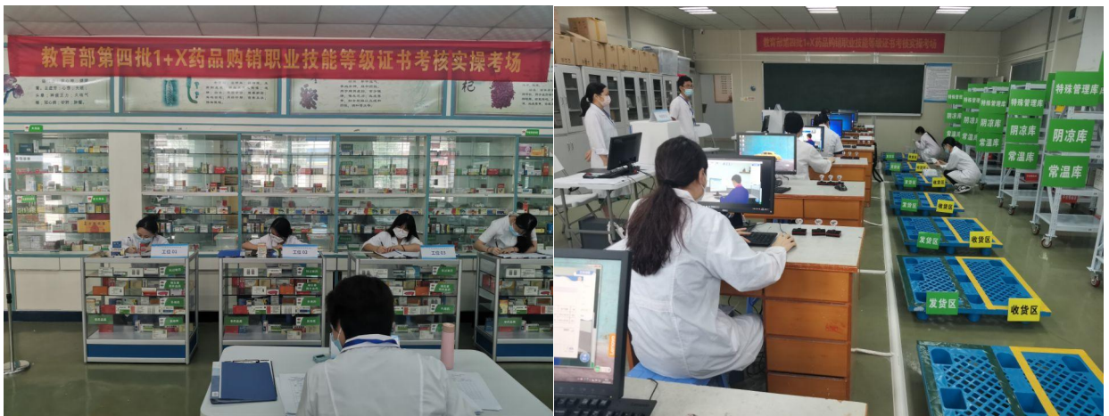
图2 第四批1+X药品购销职业技能等级证书考核实操现场

围绕专业群核心岗位群，以药师、执业药师等职业标准为依据，以宽基础强化夯实“1”，以模块化优化“X”，对标技能等级证书开发专业核心课程，达到“岗课赛证”融通，通过“4+4+X”课程体系，将“药物制剂生产”“药品购销员”等职业技能等级证书融入专业群多元化岗位中。实施“药物制剂生产”“药品购销员”1+X职业技能等级证书考核站点。根据1+X职业技能等级证书配套教材，开展教研活动研讨证书相关教学与培训工作，探索《药物制剂技术》课证融通。并面向药品生产技术、药学等专业学生，完成50人培训与考评工作。