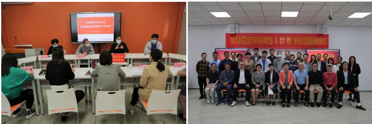
图3 企业参加药学院专业（群）教学（建设）指导委员会会议

和优化的“双论证”，持续更新人才培养方案契合度报告，根据企业岗位工作提炼典型工作任务，确定典型职业能力，制定专业课程体系，做到课程内容与工作内容对接、专业核心课程与职业活动对接。根据科技创新和企业岗位，实现专业群“基础平台课程共享、中层方向课程分立、发展性课程融合”的模块化的课程体系，共同开发创新创业类课程。