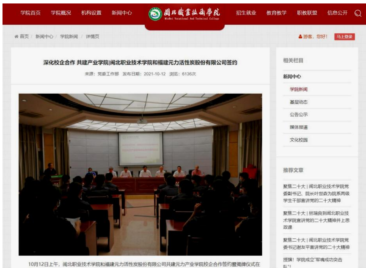
图 1 闽北职业技术学院和福建元力活性炭股份有限公司签约现场

2021年10月12日，闽北职业技术学院和福建元力活性炭股份有限公司共建元力产业学院校企合作签约暨揭牌仪式在闽北职业技术学院隆重举行。校企双方共建元力产业学院，深化产教融合，校企合作，面向产业和闽北经济社会发展需求，创新教育组织形态，推动校企协同育人，促进职业教育和产业联动发展，共同培养机电一体化技术、数控技术等专业技术技能人才。学院大力拓展与行业、企业的联系，加强在人才培养、实训基地、师资队伍及社会服务等方面的建设力度，协同开展技术研发、技术服务和职业培训，提升服务产业发展能力。福建元力活性炭股份有限公司充分发挥产业和技术积累优势，与学院在人才培养模式创新、师资互聘共用、社会服务平台搭建等方面开展深度合作、共谋发展。