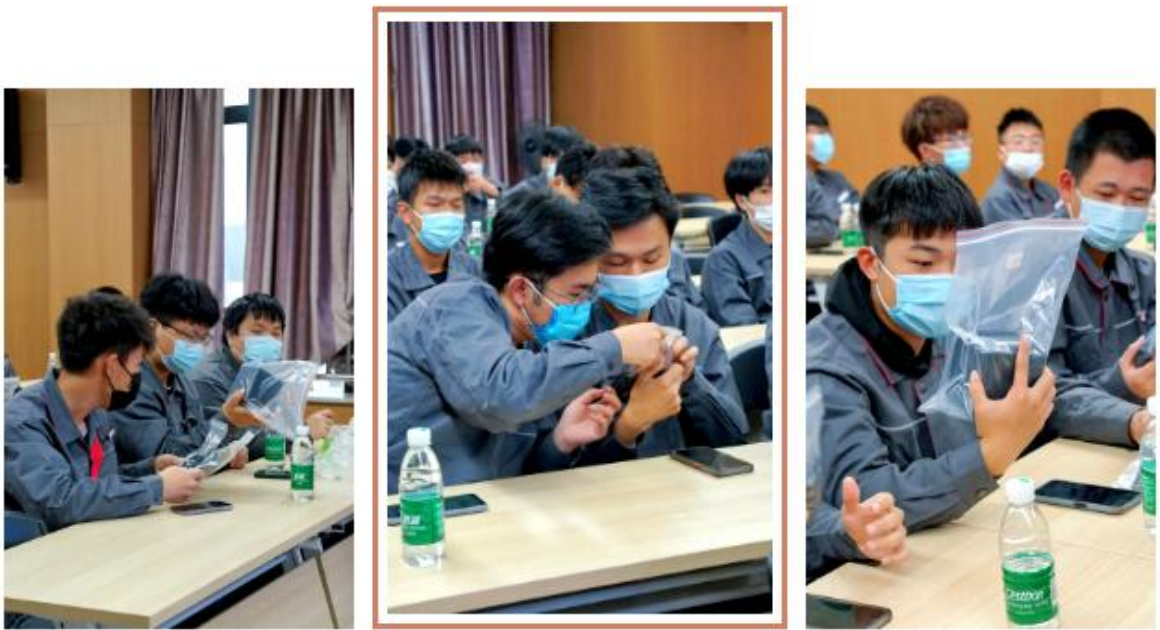
图 15 元力公司讲座现场