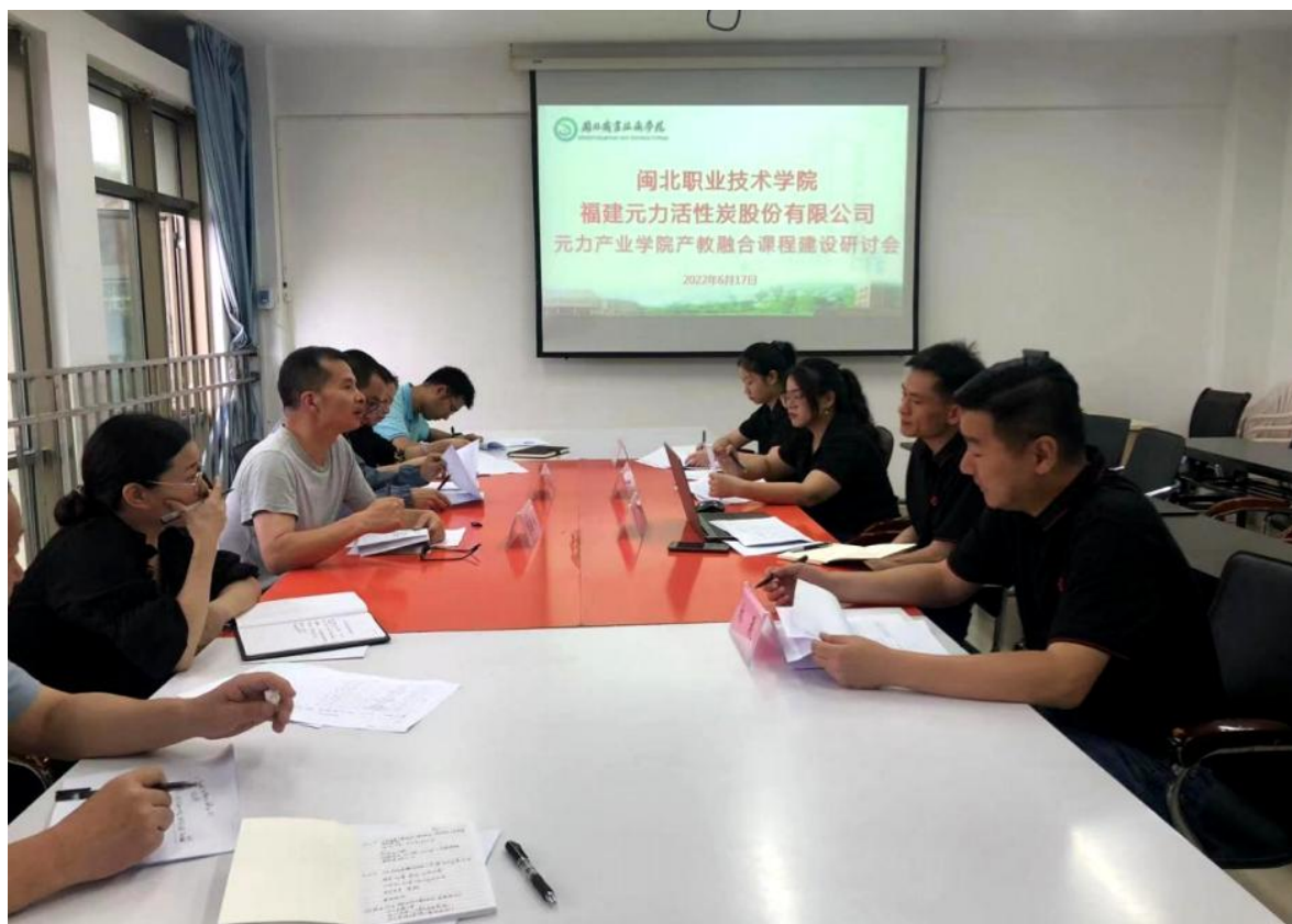
图 12 校企产教融合课程建设研讨会