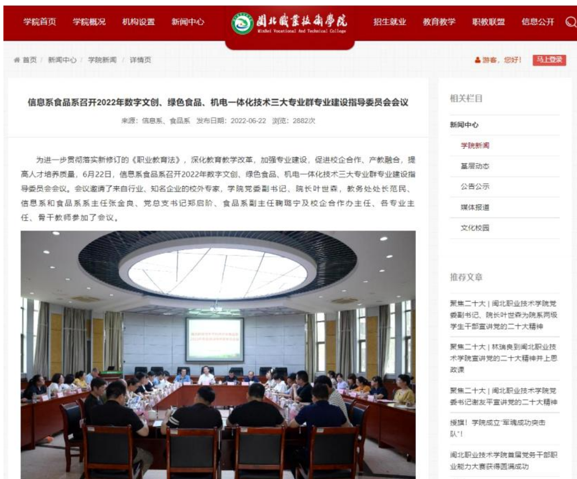
图 10 2022年专业建设指导委员会会议