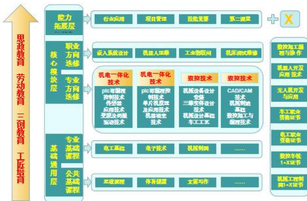
图 11 “智能制造1431”模块化课程体系