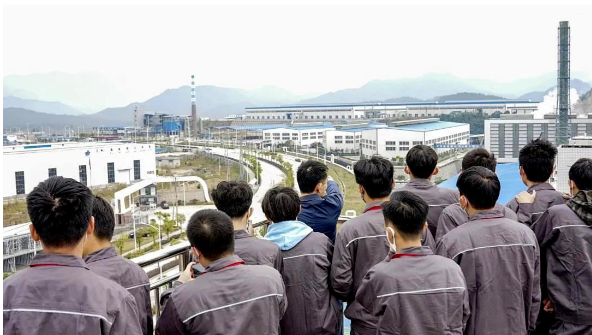
图 14 元力公司交流活动

根据元力公司对人才的需求，从“设备维修→设备技改→生产管理”三个方面全方位地培养人才，实现人才链与产业链对接，培养能够满足产业链需求的培养发展型、复合型和创新型的高素质技术技能人才。利用产业学院的教学培训资源，开展人社部门车工、电工和“1+X”工程制图员、“1+X”数控车铣工、“1+X”工业机器人操作与编程等职业技能等级证书的考证工作；利用产业学院实训平台实施企业实际项目，带动教师的教与学生的学，让学生在参与项目工作过程中，在教学过程中不断吸收和消化新知识、新技术、新工艺、新标准。