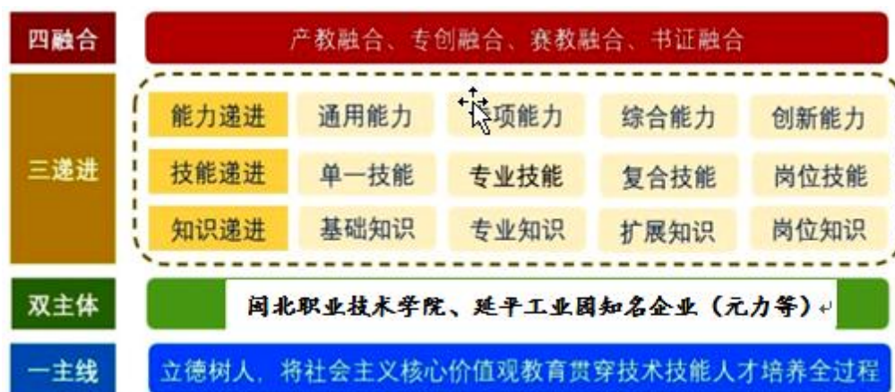
图8 “一主线、双主体、三递进、四融合”人才培养模式

对接福建省、南平市“十四五规划”，结合区域活性炭制造产业的转型升级，发挥高职院校服务区域经济的能力，结合我院的“十四五”规划，元力产业学院学生招生以三二分段制本地生源为主，以元力活性炭制造企业中心控制室、机修、电仪、巡查等职业岗位能力需求为宗旨，加强专业群课程体系整合优化，共建机电一体化技术和数控技术专业。企业领导与学校教师共同组建“专业建设指导委员会”，明确专业人才的培养目标，确定专业教学计划方案，提供市场人才需求信息，参与学校教学计划的制定和调整。校企合作共同构建“一主线、双主体、三递进、四融合”人才培养模式（如图8所示），共同制定科学规范的专业人才培养方案，解决元力公司发展过程中对技术技能人才需求的问题。