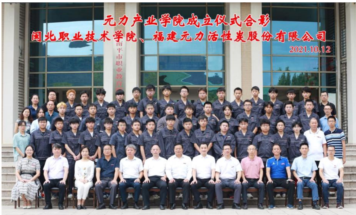
图 3 元力产业学院成立仪式合影