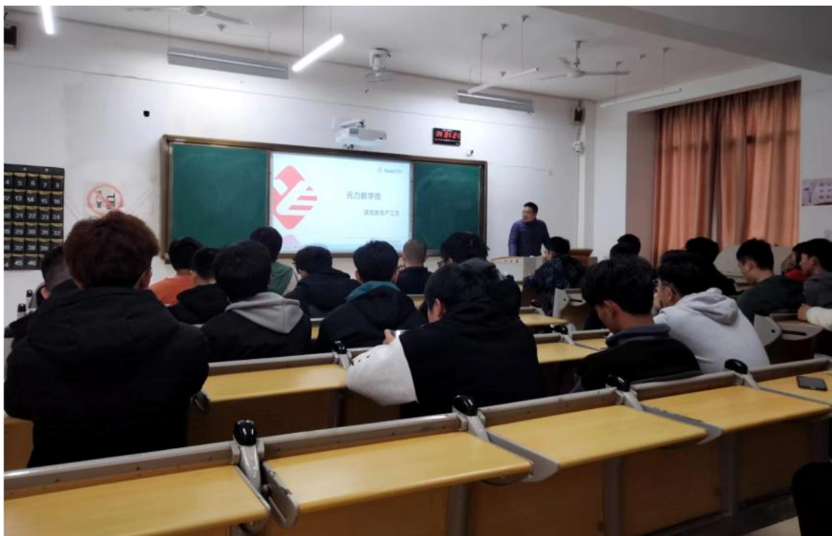
图 6 企业导师讲授活性炭生产工艺课程