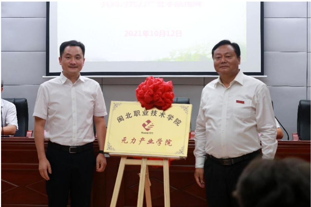
图 2 元力产业学院揭牌