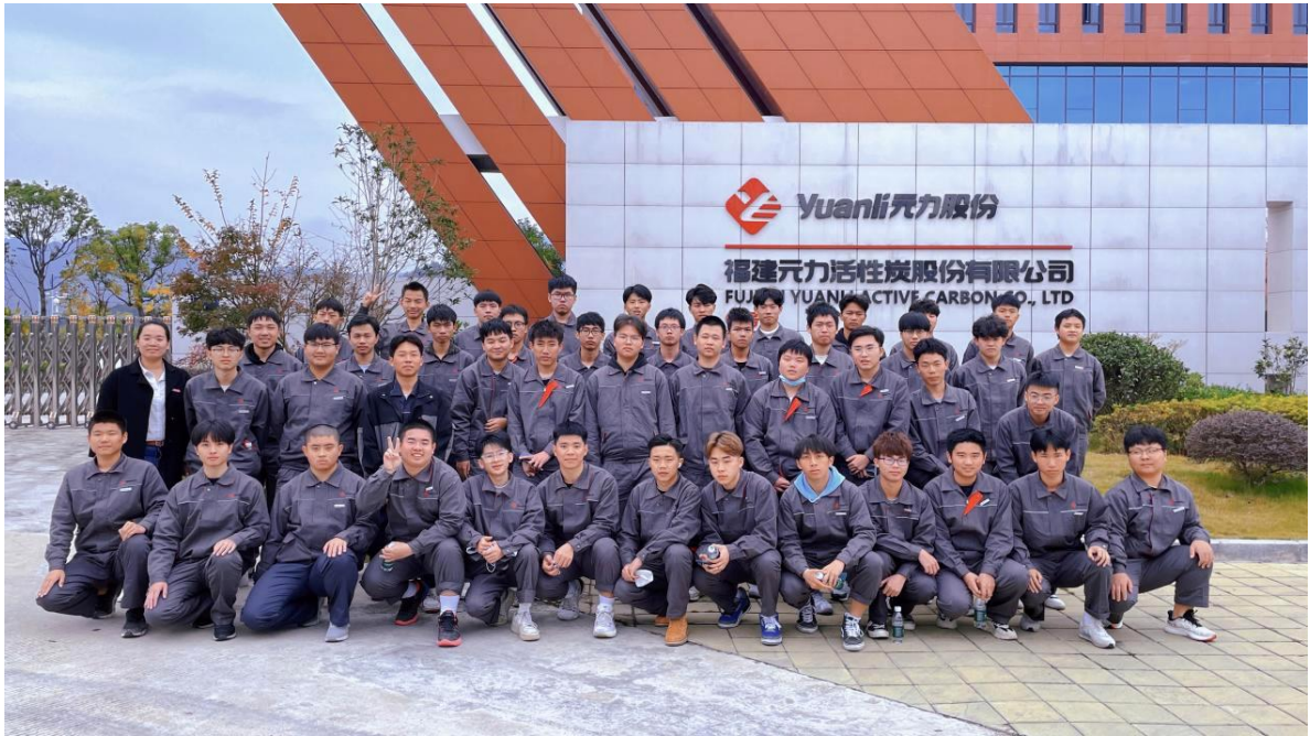
图 5 元力产业学院班师生校企交流活动合影