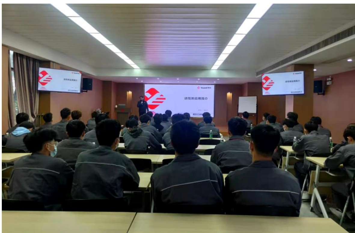
图 7 活性炭应用专题讲座