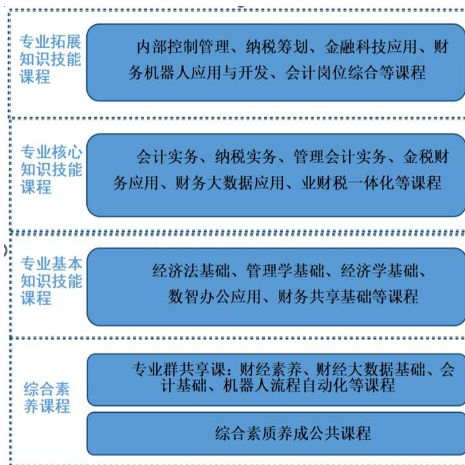
图 4.2 四进双融的课程体系

课程岗位融通、技能技术融合，重构“综合素养—专业基本知识技能—专业核心知识技能—专业拓展知识技能”的课程体系，建立“认岗—知岗—跟岗—顶岗”的实践教学体系。