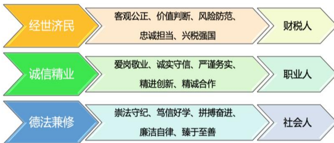
图 4.1 价值塑造图

政行企校协同,价值塑造、知识传授、技能培养三位一体,建立“德法兼修、诚信精业、经世济民”的价值塑造图谱,培养学生从社会人到职业人再到财税人,将数字能力贯穿职业知识技能,培养会智能财税核算、精智能财税分析、懂智能运营规划的高素质技术技能人才。