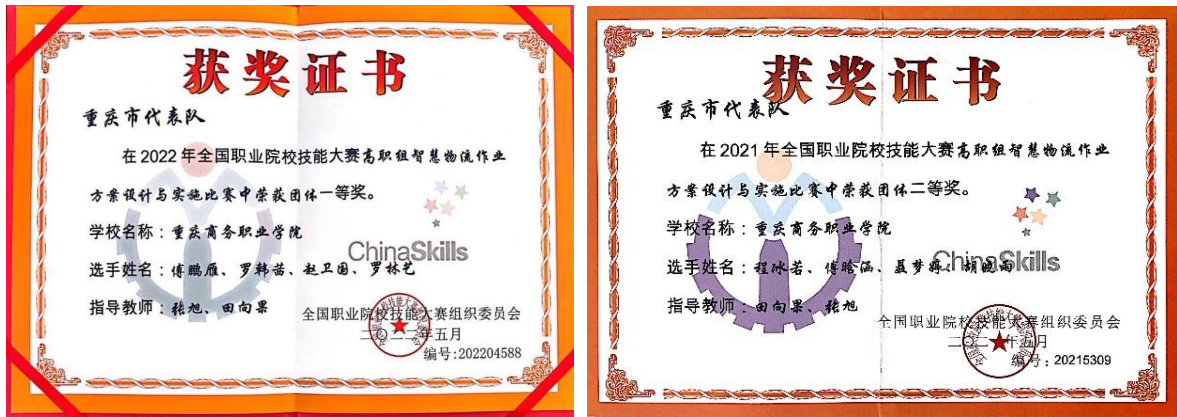
图 6：全国职业院校技能大赛获奖证书