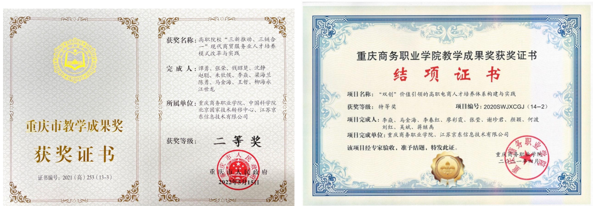
图 7：教学成果奖获奖证书

校企共同开展教学改革研究，立项重庆市高等职业教育教学改革研究项目多项。学校与京东总结校企合作经验，共同申报的高职院校“三新推动、三链合一”现代商贸服务人才培养模式改革与实践项目获重庆市教学成果二等奖，“双创价值引领的高职电商人才培养体系构建与实践项目获重庆商务职业学院校级教学成果特等奖。