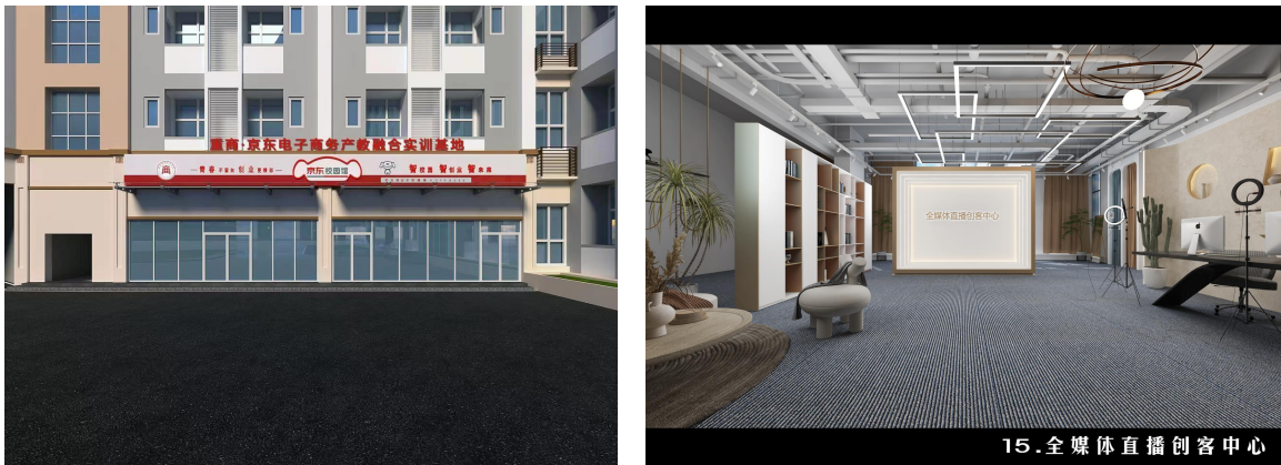
图 2：重商-京东重庆电子商务现代产业学院部分场地

采用“专业+产业”多元化办学模式，联合培养电子商务、物流管理等专业领域的管理及技术技能型人才。