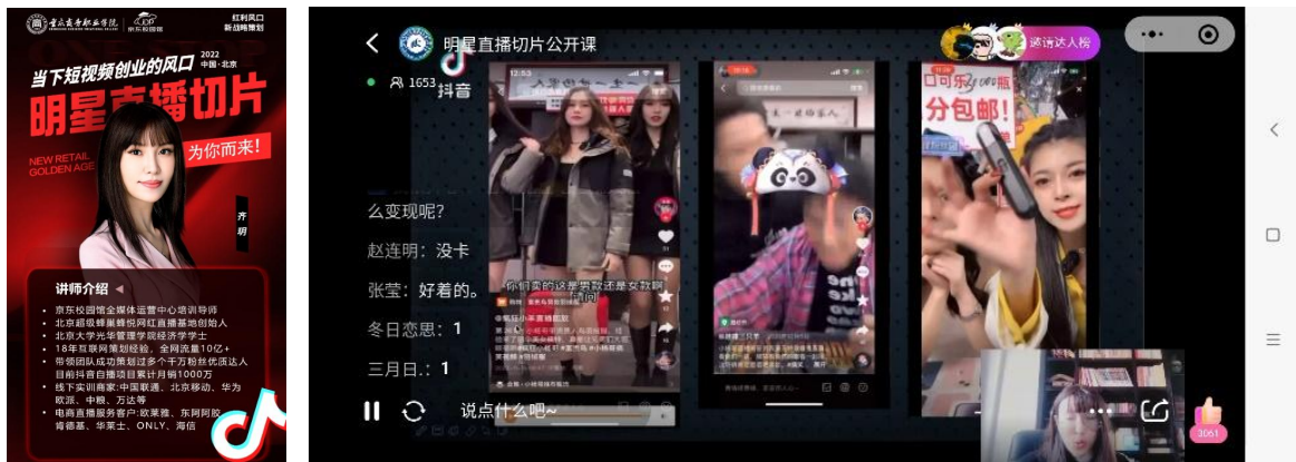
图 5：“重商-京东重庆电子商务现代产业学院线上公开课第一期

校企成立专业教学指导委员会。聘请行业企业专家、项目主管、能工巧匠、企业师傅担任兼职教师，建立了 40 多人“身份互认、角色互换”的校企人才库。建立教师企业实践流动工作站，实现了行业企业兼职教师和专业教师常态化双向流动。建立校企双导师制，企业与学校共建的双导师团队能较好地打通学校和企业之间的关系，及时了解行业发展和需求，校企双导师团队定期开展课程教研会议、教学诊断活动，优化教学模式和教学方法。