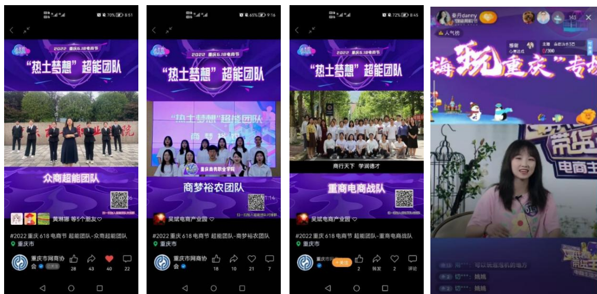
图 8.参与乡村振兴直播活动

校企合作助力乡村振兴，承担 2022 年乡村振兴定向帮扶城口县工作任务—发挥学校电商人才培养优势，强化校企合作，助力城口县电商产业发展及人才培养，完成《城口县电子商务管理 人员专题培训班工作方案》。学院组队参加重庆商务委主办的 “618 电商节” 系列活动——“热土梦想” 超能团队计划活动。6 个团队成功入围配对帮扶心愿乡镇（村）。