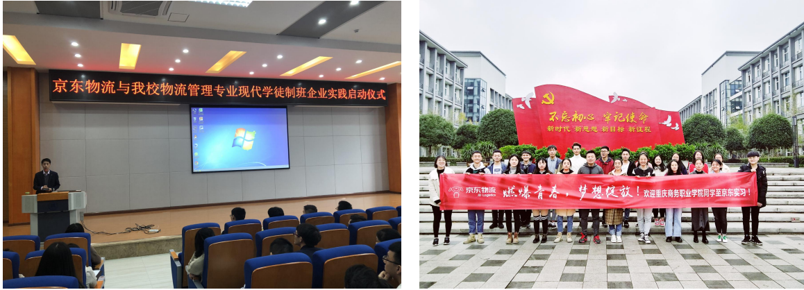
图 4：“京东班”启动及企业实习