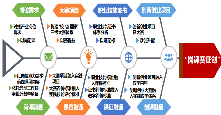
图 6 岗课赛证图示

校企双方始终围绕“巴渝工匠 2025”行动计划，依托重庆科创职业学院国家众创空间实践平台，高技能人才培训基地，强化数字技能人才长学制培养，深化校企合作、产教融合，持续开展“大师带教师·专家带专业”活动，建设数字化产业产教融合基地。深化“一体化”教学改革，着力推进数字化、智能化、信息化岗课赛融通，加强“智慧校园”“数字校园”建设，建立起 VR 现代仿真实训室，以数字技能人才需求指引，数字技能人才紧缺职业工种目录，数字技能人才创新创业指数制定学院人才培养体系，形成岗课赛证一体化人才培养体系。