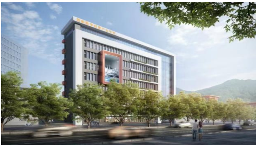
图 1 西部数字创意产业学院效果图