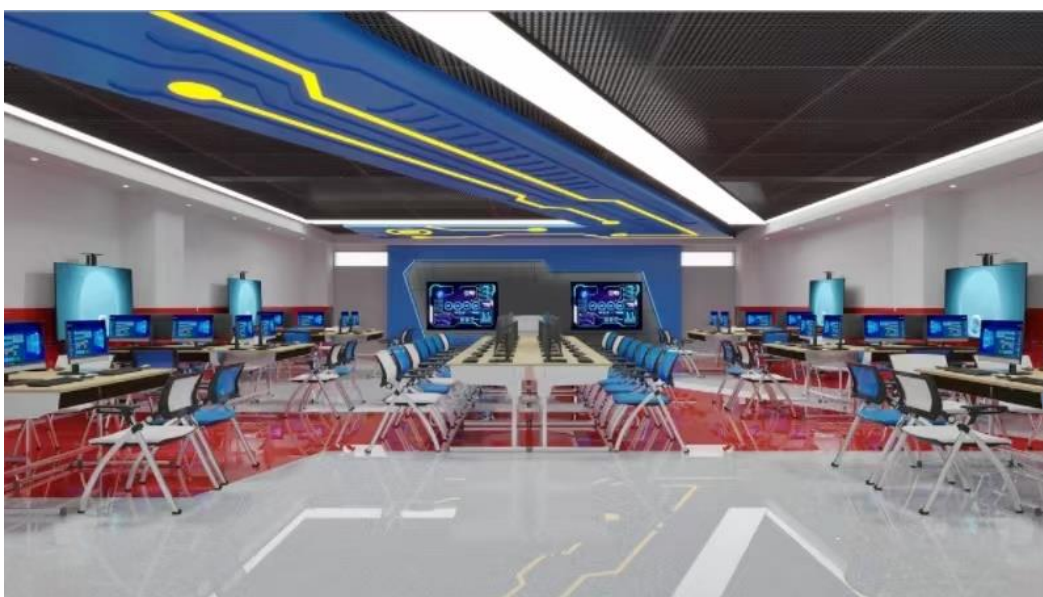
图 14 电子竞技运动与管理实训中心