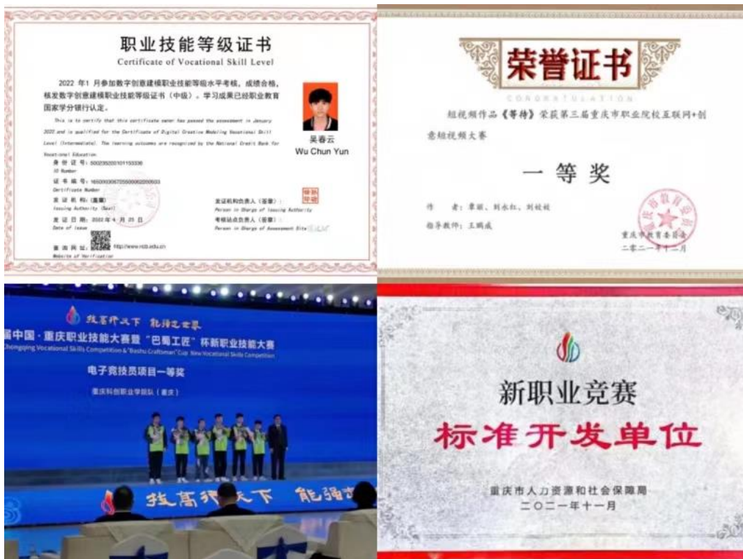
图 8 赛证图示