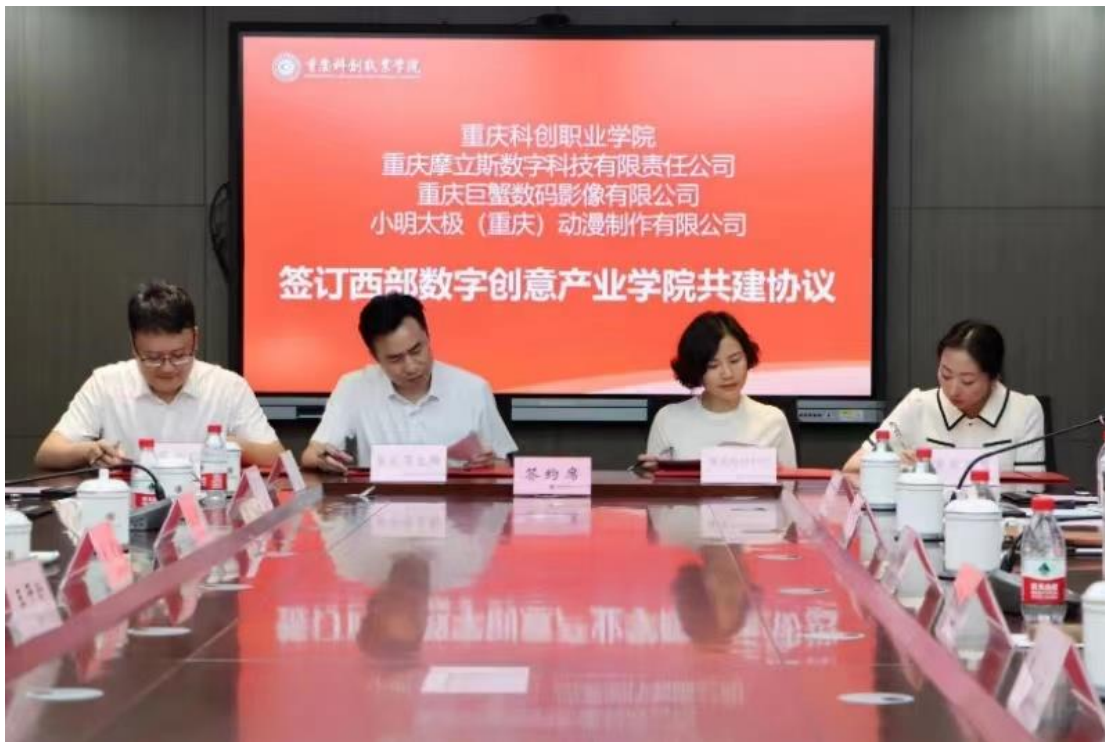
图 3 签定共建西部数字创意产业学协议