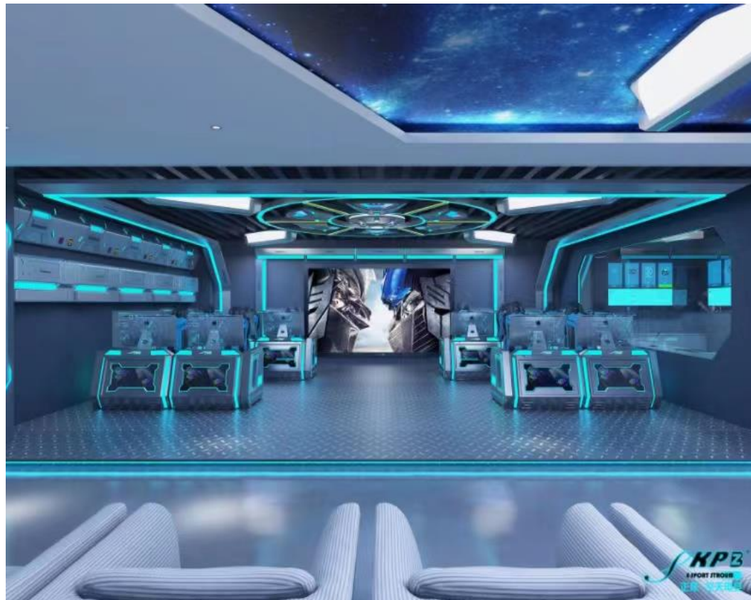
图 12 数字媒体技术实训中心