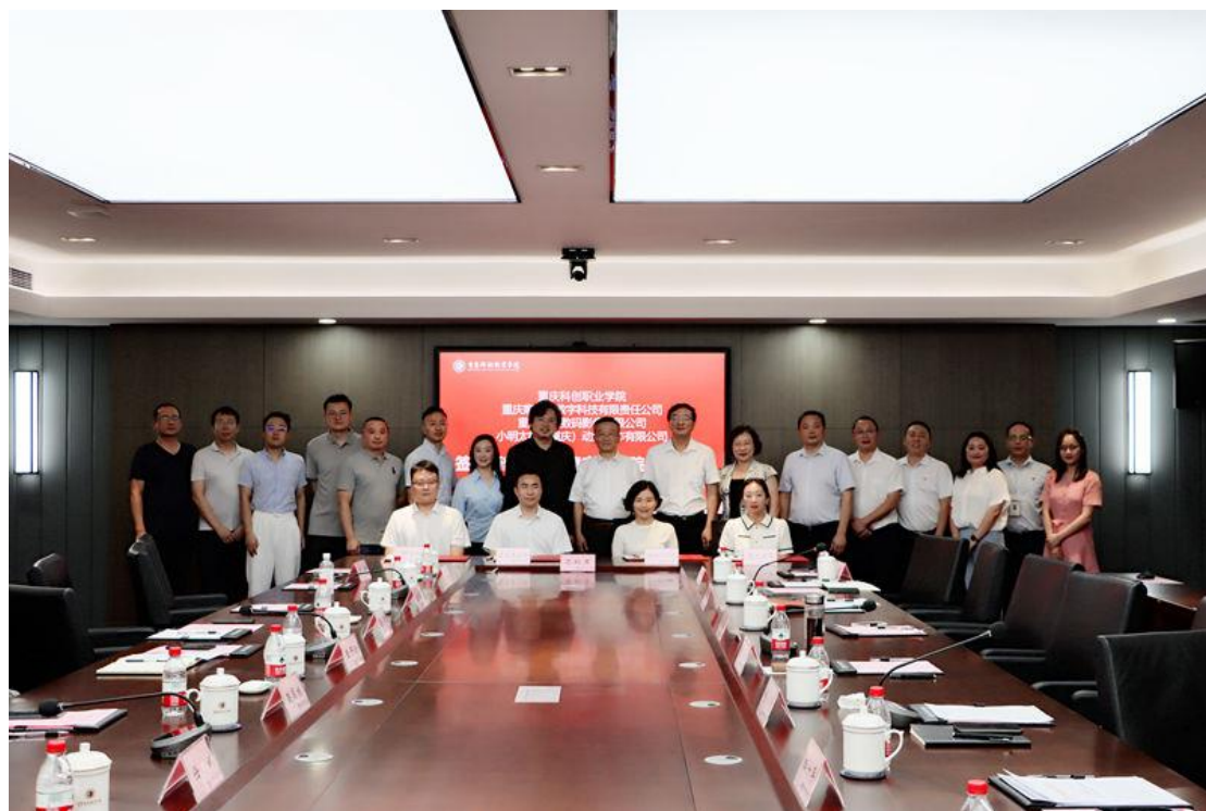
图 2 西部数字创意产业学成立仪式