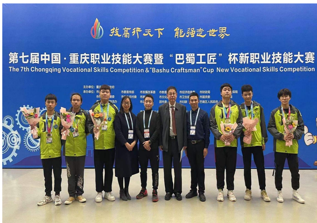
图 16 巴蜀工匠杯新职业技能大赛