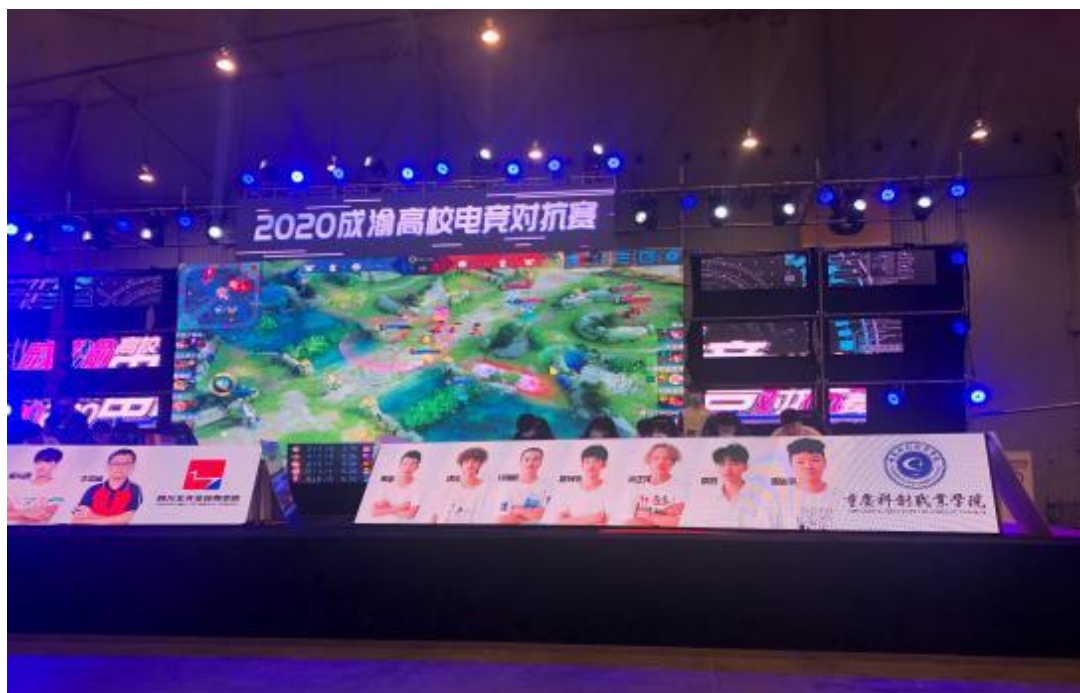
图 15 承办 2020 成渝高校电竞对抗赛