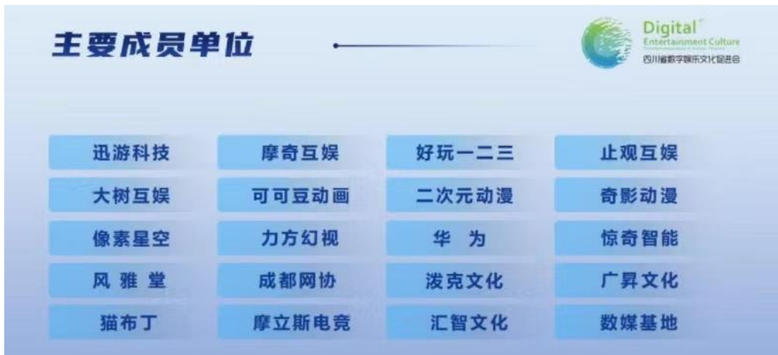
图 7 岗位提供单位