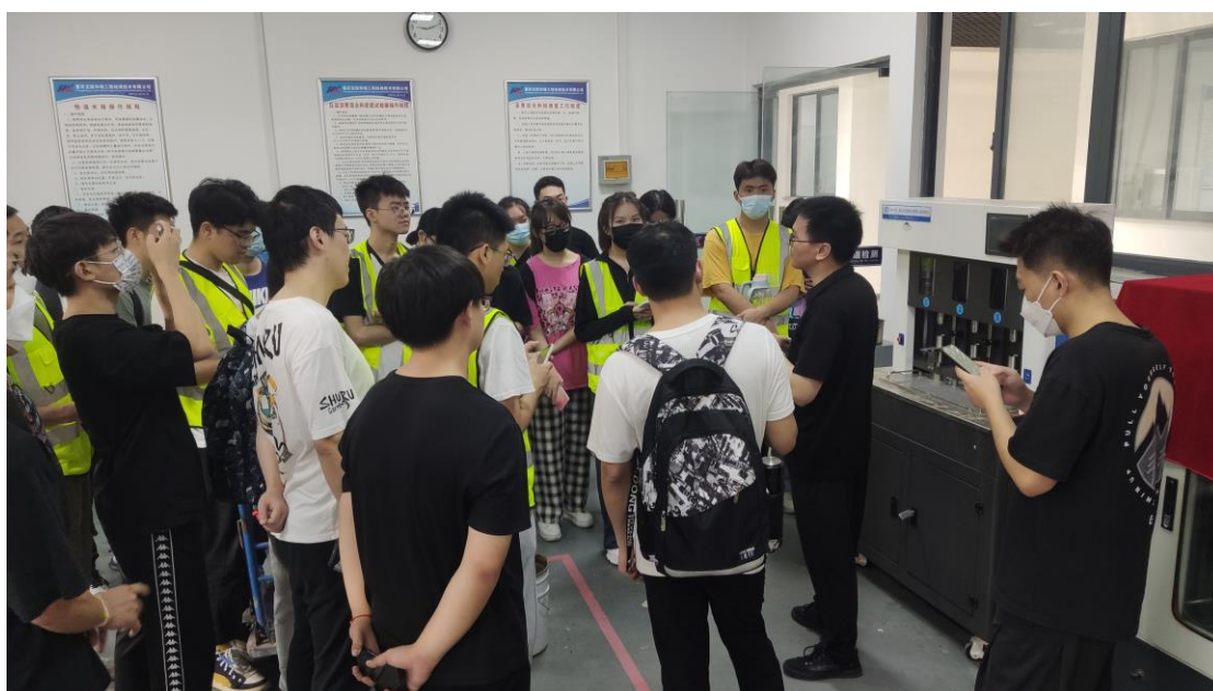
学生学习检测设备

身份及校企一体、岗学一体，开展专业核心课按企业岗位标准要求进行“准岗式”教学。专业核心课教师与校办企业签订企业技术管理聘用合同，企业教师与学校签订外聘教师聘用合同，共同完成课程教学、课程体系建构、资源建设、标准更新。学生既按检测技术岗位要求学习，又按企业标准承担检测员、资料员等岗位工作。在企业真实职业环境中完成实际生产项目的工作，遵守企业制度和行为规范，实现职业素养与企业文化对接。