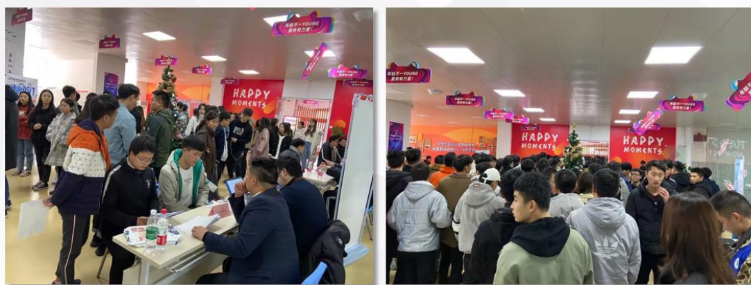
学生参加企业招聘