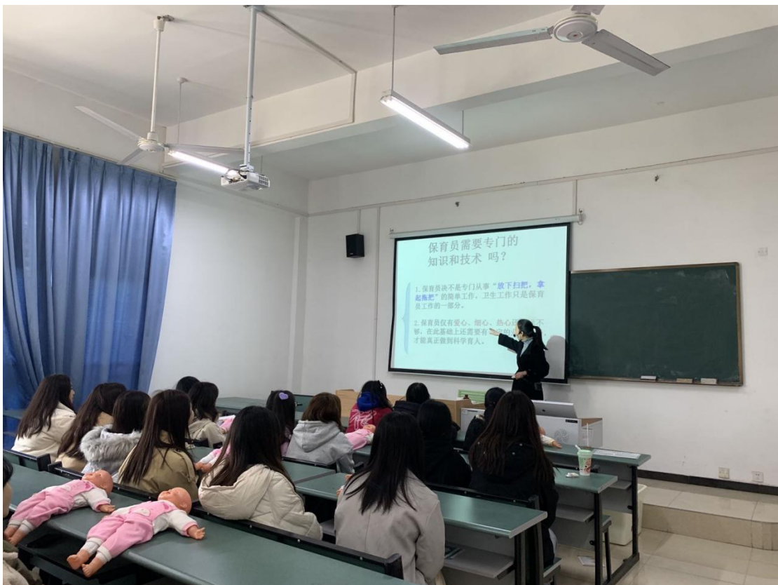
图 5 婴幼儿托育服务与管理专业一蒙特梭利课程正在授课