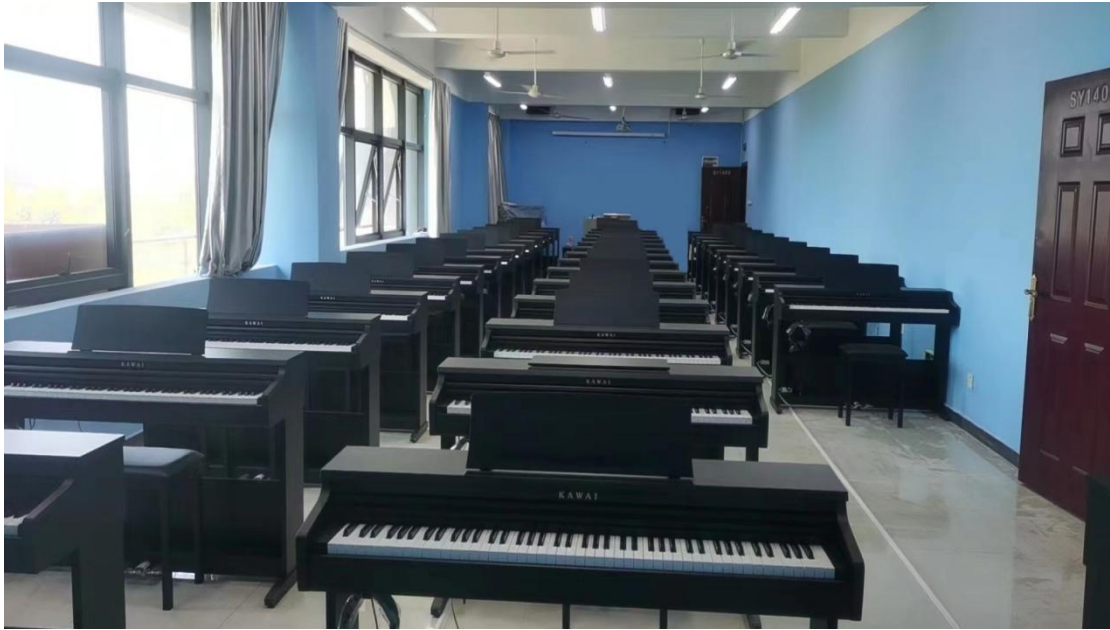
图 4 婴幼儿托育服务与管理专业钢琴实训室