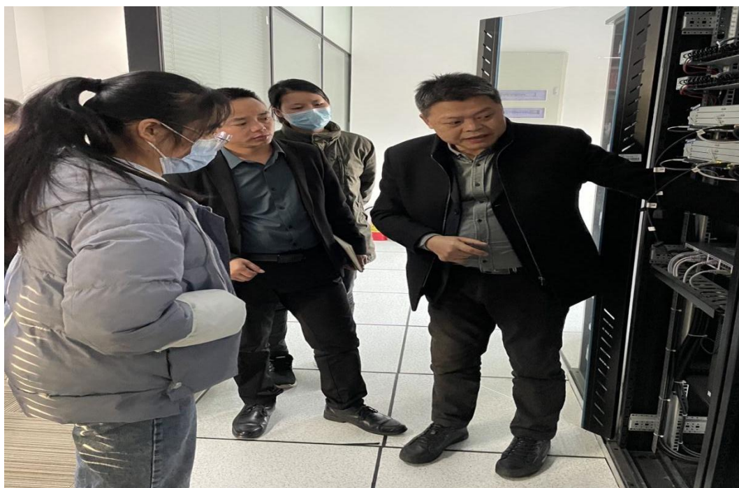
图 3 软件技术专业实训服务器