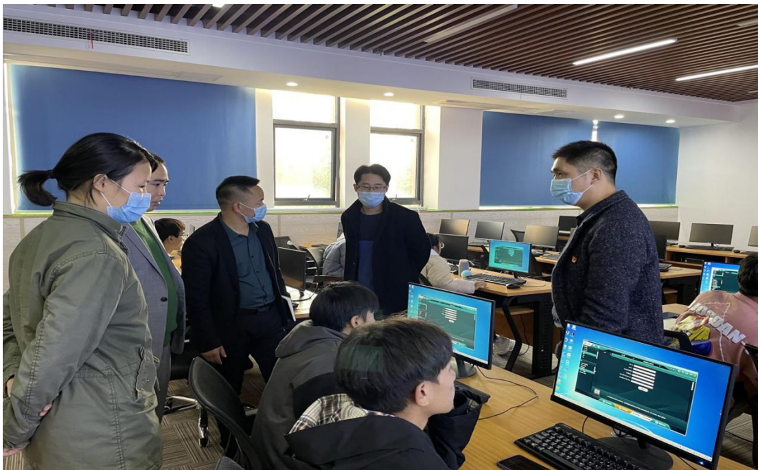
图 2 通信专业职业技能竞赛练习中