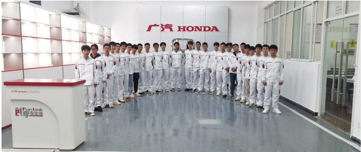
广汽本田汽车服务技术定向班合照

务技术定向班，实行小班教学，企业与校方共同拟定定向班教学计划，共同开发的教材，定向班由企业培训考核后认证的校方教师共同承担定向班教学，课程结业考核分为理论考试和实作考核，实现我公司的全国合作院校统一联考，考核由公司负责组织实施。