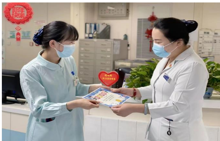
图 4 北医三院带教老师指导学生

北医三院非常重视教学科研工作，具有完备的教学教育基地，为学生提供全面的教學服务，包括多种的教学设施和教学资源。目前管理教室及示教室共 12 间，总面积达 561 平方米，全部拥有完备的现代化教学设施。目前，医院教学场地总面积达到 1800 平方米，包括全系列临床技能培训中心、基于云技术的多媒体教室等。自 2018 年我院与北医三院成立“北大医疗合作班”（又称南丁格尔工作室）以来，我院根据医院的具体要求对即将下临床实习的护生进行有针对性的实践技能集训，并开展护士礼仪（包括穿着服饰和体重管理等）、沟通技巧（包括医院面试和护患交流等）、就业创业能力等的“一对一”辅导，护生进入临床后，在实习大纲的指导下轮转临床科室，每一位学生都是由南丁格尔工作室的老师亲自带教，从开始的手把手亲自教，到离手不离眼的技能提升。学生在此教学模式下，从理论到技能，从素质到修养都有大幅提升。