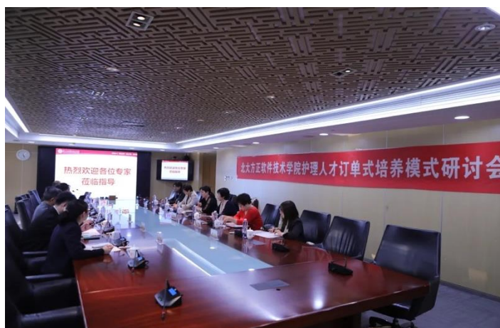
图 1 护理人才订单培养模式研讨会

医院行业专家与学院骨干教师实现了共同设置人才培养模式、共同开发课程、共同集体备课、共同建设实训基地、共同评价学生、共同进行教学研究。在教学评价方面，每科室出科前都有考核，将本科室常见疾病护理理论知识和操作技能合并考核，合格后可进入下一科室轮转，其中理论试卷除参考历年执业护士考试标准外，精选 30%~40%的实践操作内容；在实践考核过程中将其涉及到的重要理论知识作为口试形式进行考核，并引入社会评价体系，医院带教教师与学院专任教师共同制订考核标准，共同完成考核过程。