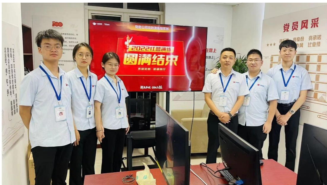
学生参加护网行动