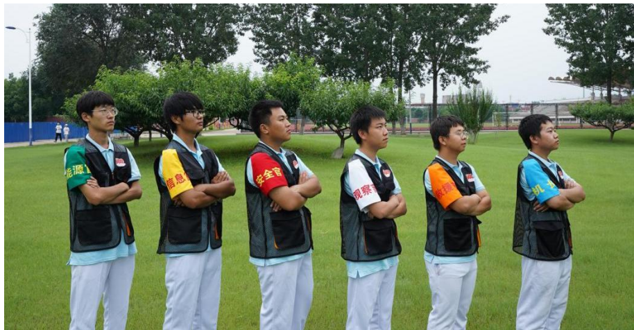
图2 无人机驾驶技能实训图

准，实训标准结合了学校及企业的实训体系，实训过程实行团队体制，团队中每一个人都具有“职位”，使得学生各司其职，并进行职位互换，体验不同岗位以及岗位职业标准，促进学生实训过程中严格按照标准规范进行操作，提高学生职业素养以及全面提升学生职业技能，培养学生工匠精神，且学生在参与企业项目过程中，得到了企业对学生能力及职业素养的一致认可。