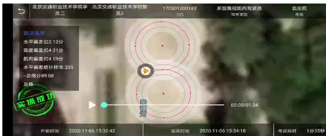
图4 1+X 教管平台

针对无人机应用技术领域，开发了无人机教学平台，涵盖了实践教学资源以及教学课堂的评价，可以实时动态看到学生的训练水平、学习状态以及对学生的训练指导，将学生学习状态及评价方式融入信息化管理，创新了课堂评价模式，实现了实训系统的标准化和可视化，教师实时掌握学生学习动态以及学生实训过程中存在的不足，创新课堂评价方式，提高学习效率。