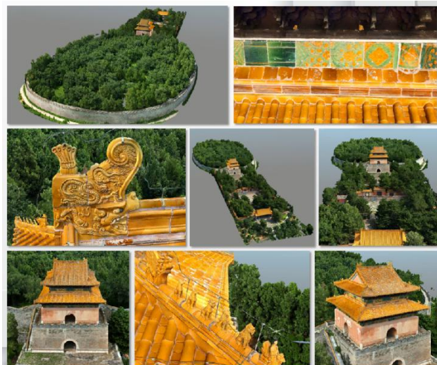
图5 明裕陵无人机贴近摄影测量模型建立