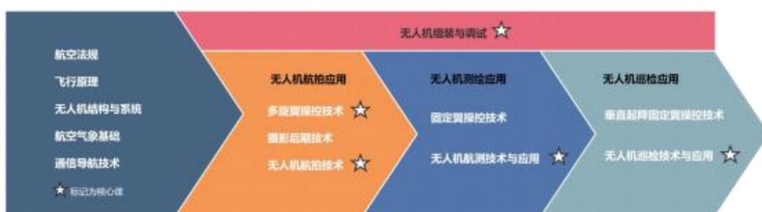
图6 人才培养方案核心模块

通过专业行业及企业与学校的多次人才培养方案的探讨与研究，将无人机专业主要课程标准、实训教材、实训室建设方案，重构融入于无人机应用技术专业人才培养方案。在人才培养模式构建过程中，借鉴企业在无人机应用领域的课程理论及实践技能，依据实际项目的知识能力需求，结合学生学情分析，对无人机课程进行开发，将无人机应用技术课程分为4个模块，其中，应用模块分为4个应用场景，每个子任务包含一个实际项目，使学生理论与实践相结合，在实际项目的驱动下完成课程任务的学习，方案核心部分如下图9所示：