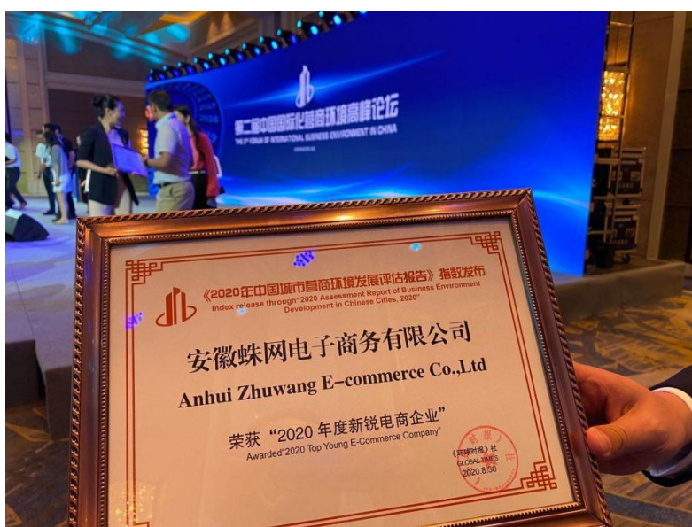
图 1 公司奖项：《环球时报》颁发的 2020 年度新锐电商企业奖