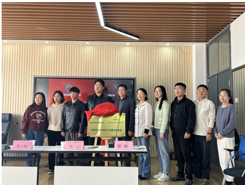
图 3 安广蛛网跨境电商中国特色学徒制开班挂牌