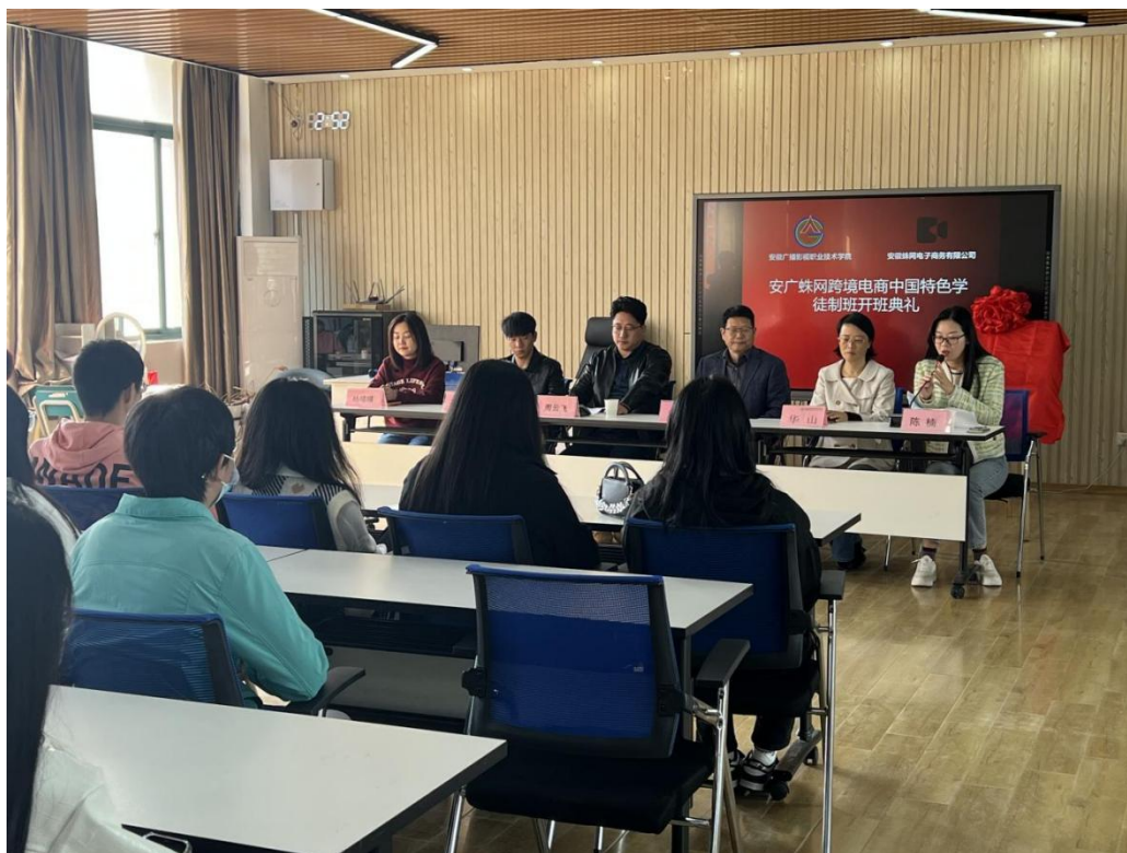
图 2 安广蛛网跨境电商中国特色学徒制开班典礼