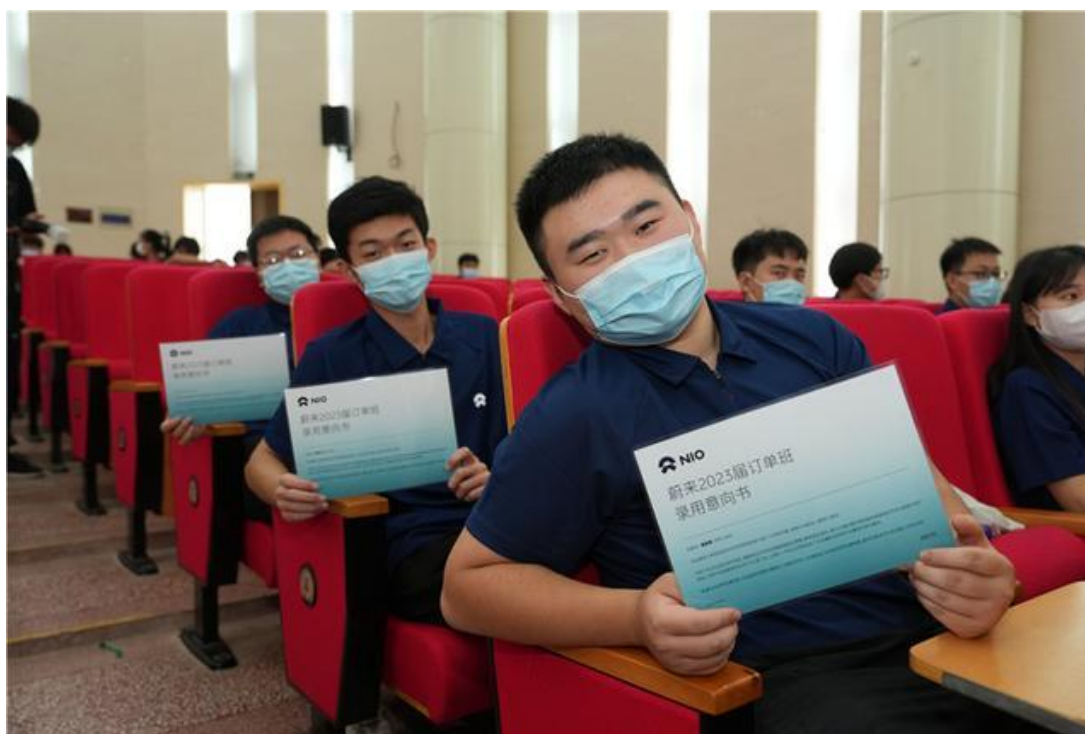
图-39 蔚来订单班学生入职蔚来

目前第一届蔚来校企合作订单班的学生共65人，已经完成全部学习内容奔赴工作岗位，留职率为100%，岗位认可满意度100%。