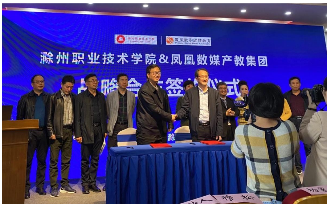
图2 滁州职业技术学院&凤凰数媒产教集团战略合作签约仪式

为国内广大院校提供全球领先的教育服务，先后与国内外知名院校合作，以共建凤凰数字创意产业学院、凤凰数字创意产业园等形式，为国家数字创意产业的发展培养高素质应用型、技能型人才。自2020年12月以来，凤凰数字创意产业学院以滁州职业技术学院推进地方技能型高水平大学为契机，坚持“地方性、技能型、合作式、特色化”的办学路径，坚持“产教融合，校企合作”的办学模式，坚持“以服务为宗旨，以就业为导向”的办学方针，根据市场发展需求和企业岗位需要，不断调整专业设置，改革教育模式，转变人才培养模式，积极探索多种联合办学形式，加强科学研究、人才培养、学术交流和教学实践等方面的精诚合作，积极开拓创新，着力探索校企合作的新领域、新途径，进一步加大校企合作力度，推进产教学研融为一体，进一步推动人才培养供给侧与产业需求侧紧密对接，更好地为提高滁州市区域数字创意产业竞争力和汇聚产业发展新动能提供人才支持和智力支撑。在合作办学过程中，校企双方加强统筹协调，创新合作模式，完善沟通机制，坚持以学生发展为中心，立足滁州，辐射安徽，瞄准长三角一体化发展，积极引入“政产学研用”各方优势资源，推动数字创意战略性新兴产业集群式发展，形成产教、产城协同发展的良好态势，取得互利共赢的丰硕成果，努力把学院建成校企深度合作，服务经济社会高质量发展的样板和典范。