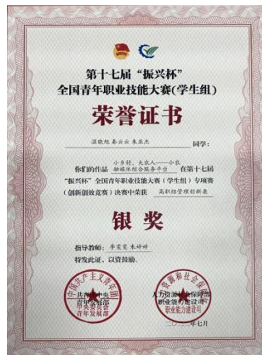
图 12 在校学生技能竞赛获国赛银奖

借助凤凰数媒产教集团多年的赛事服务经验及成果，推动学院开展各类创新创业赛事活动及学生创业实践活动，提高学生的创新创业意识、助力学生创业团队在“互联网+”创业大赛产业赛道中取得优异成绩、最终提升学生团队的创业成功率。