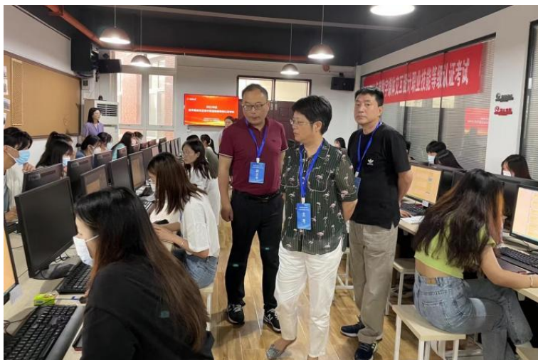
图7 凤凰“1+X”数字媒体交互（中级）考证现场

2021年11月29日凤凰派驻2名行业工程师，携带行业真实项目对学校传播与策划专业和动漫制作技术专业学生开展为期一个月的实训营活动，实训营期间由凤凰行业工程师利用行业真实项目和行业相关管理流程为学生打造真实企业环境，提升学生技术技能水平和就业能力。