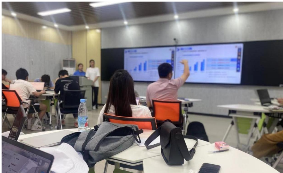
图 13 在校师生开展产学研主题探讨会

将凤凰数字创意全国“双师型”教师培养基地落户凤凰数字创意产业学院。凤凰数媒产教集团围绕影视、游戏、动画、虚拟现实等行业前沿技术应用，采用企业考察、行业实践、专业建设研讨、教学共创、案例评审等多种形式，持续为全国学校专业建设负责人、核心骨干教师赋能，助力“双师型”教师团队建设。