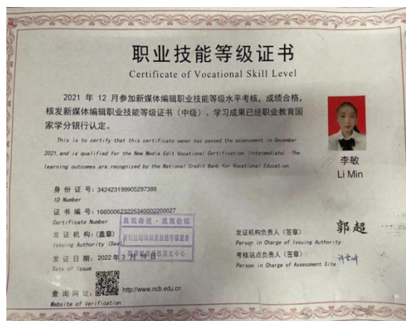
图 10 “1+X”考证证书获取情况示例