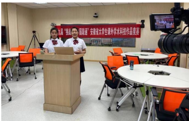
图 11 遴选的学院参加线上竞赛现场

构建凤凰数字创意产业学院“大学生就业创业中心”，采用网络招聘、线上说明会、线下双选会的形式构建对口高质量就业体系。凤凰数字创意产业学院“大学生就业创业中心”面向全校和社会开设创新创业指导课程，凤凰数字创意产业学院专家指导委员会单位创业项目指导，引入风险投资资金设立创业孵化资金池等充分提升凤凰学院创新创业水平。