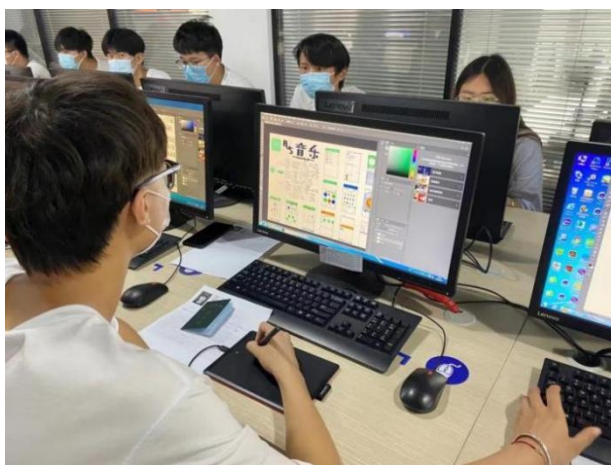
图 9 凤凰“1+X”新媒体编辑（中级）考证实操现场

组建凤凰数字创意产业学院双元制办学主体，通过产业学院理事会机制切实发挥凤凰数字创意产业学院双主体优势资源和能力。构建人才培养双主体模式，人才培养过程中企业主体承担不少于 40 学分、1000 学时的专业课程教学和实习实训实践环节；构建学生双主体身份，学生入学既是学校学生也是凤凰数字创意产业学院工作室员工，双主体协同工作、发挥各自优势，为学生构建可持续发展能力。针对职业岗位要求，加强基础和实践性教学环节，突出实践技能训练和培养，教学内容更贴近生产，坚持实际、实用、实效的原则，以岗位需求为导向，以职业能力为重点，构建起“宽基础、活模块、复合型”的智能结构。