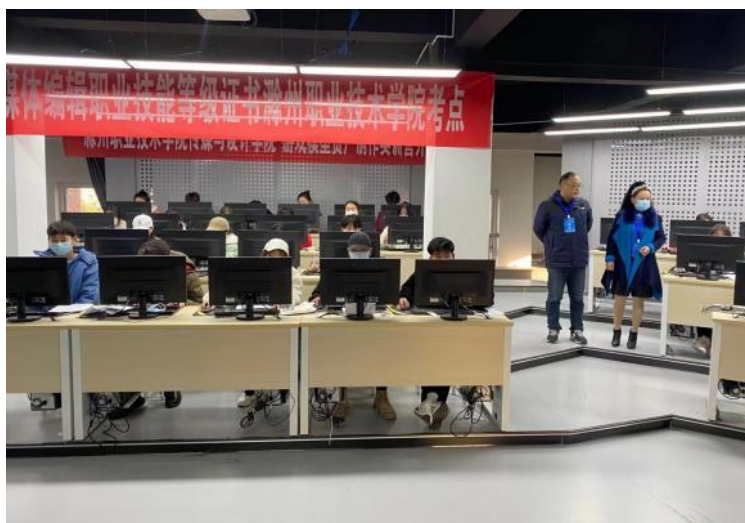
图8 凤凰“1+X”新媒体编辑（中级）考证现场