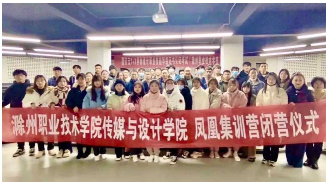
图6 凤凰数字产业学院集训营闭营仪式

打造优质团队，推动教育实践变革。针对人才培养与产业发展不紧密、与社会服务不贴合、学生创新实践精神和社会责任感不够强等普遍、突出性问题，自2020年起，依托凤凰数媒的优质资源和平台，以“政校行企”和“三全三融”创新人才培养模式，成功开展了多场线上线下“教学沙龙”，开办第一期凤凰数媒“资产模型、新媒体编辑”集训营，共招募70余名数字媒体系的学生参与培训，有效的创新了校企协同育人新模式。