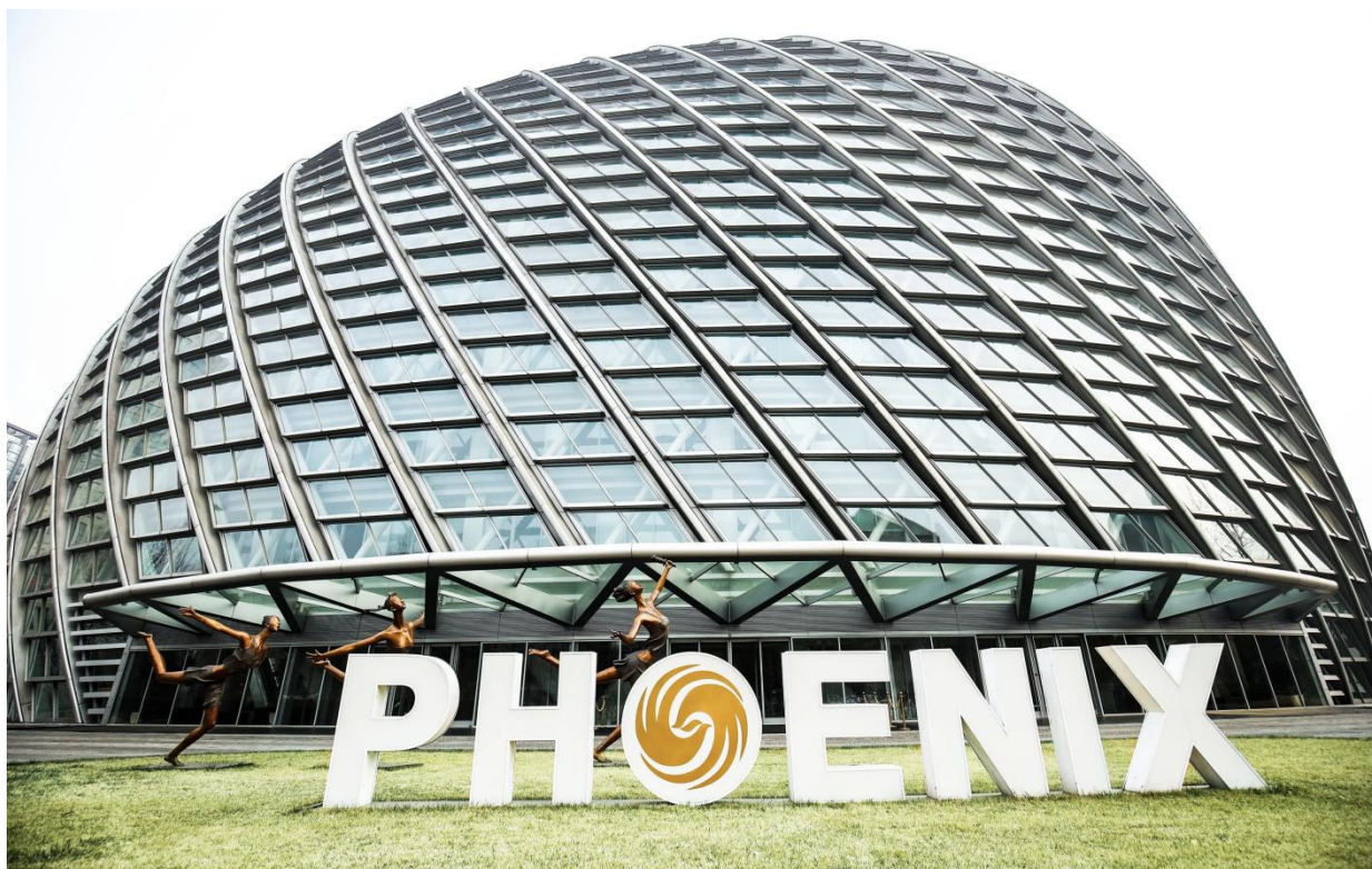
图 1 凤凰卫视北京总部办公大楼

凤凰卫视集团（以下简称集团）成立于 1995 年，以拉近全球华人的距离、影响有影响力的人为宗旨，致力为全世界华人提供高质素的华语电视节目。凭借独特定位、全球视野和成功的拓展策略，经过 21 年的努力，集团已经从一个单一频道的电视台，发展成为拥有中文台、资讯台、欧洲台、美洲台、电影台和香港台 6 个电视频道，超过 3.6 亿观众的跨国全媒体集团。目前，集团在全球五大洲共建有 60 个记者站，制作团队遍及全球五大洲。影响覆盖 180 个国家和地区。集团并同时发展互联网、周刊、户外电子大屏幕、出版、广播、教育、文化、金融和游戏等多元化业务。2021 年 4 月，紫荆文化（香港）集团有限公司入主凤凰卫视，凤凰卫视成为国家控股企业。