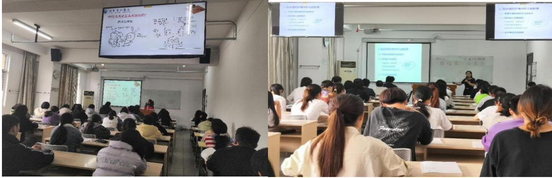
图 15 理论授课