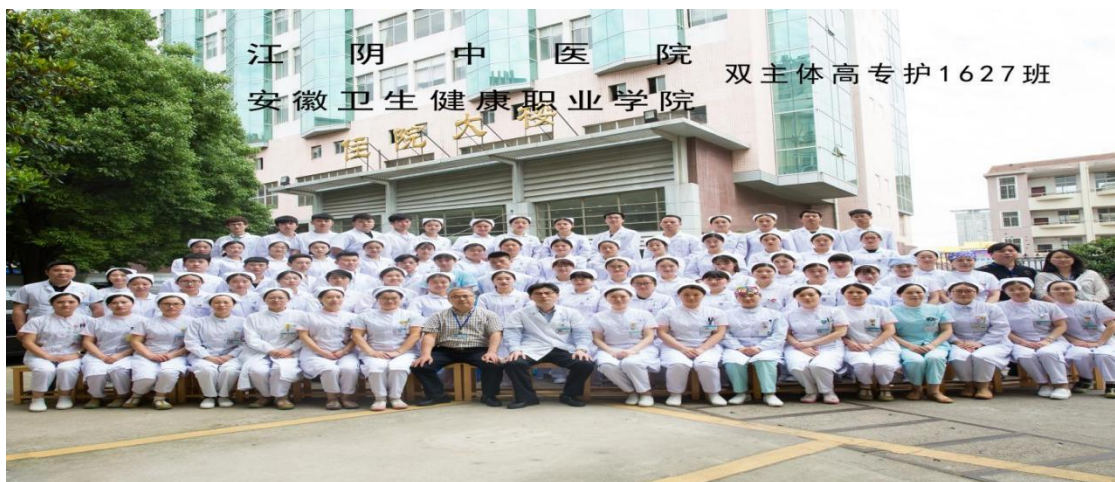
图5 首届护理床边班 1627 班毕业照

通过和院校合作，采用床边班、见习、实习等形式，理论和实践相结合促进医教研协同发展。