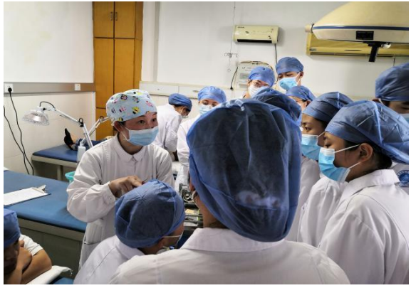
图 19 临床见习