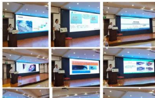
图 24 开展带教老师授课比赛，以赛促教。

老师们激情展现自己的教学风采。教学深入浅出、方式多样化，互动强，有现场教学、有情景模拟、有视频、有模型、有案例分析、有共情、有提问、有思考，授课内容引人入胜，突破以往的单一PPT授课模式。