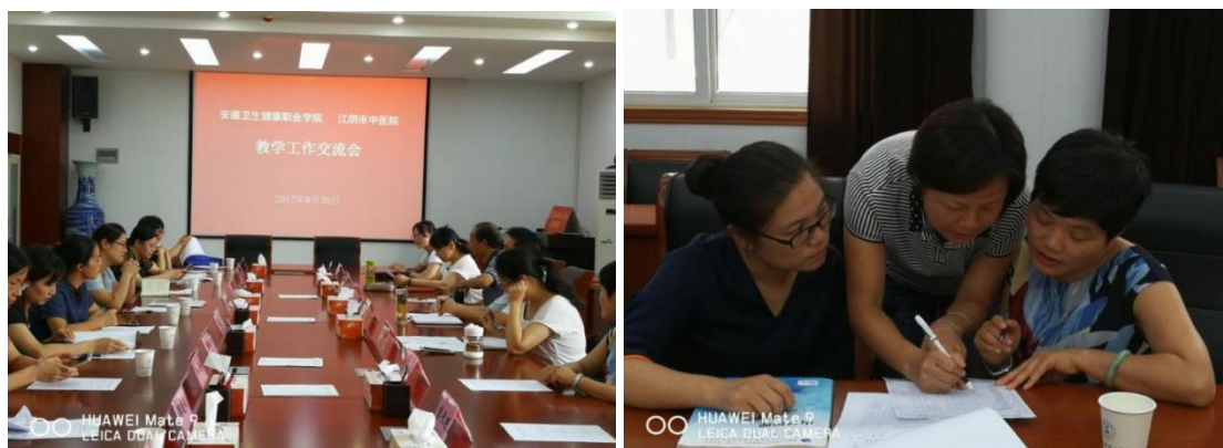
图3 校企教学经验交流会