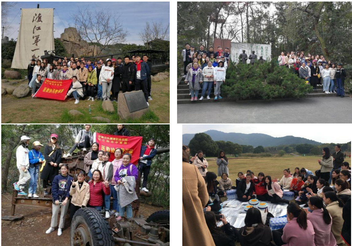
图 23 团建活动剪影