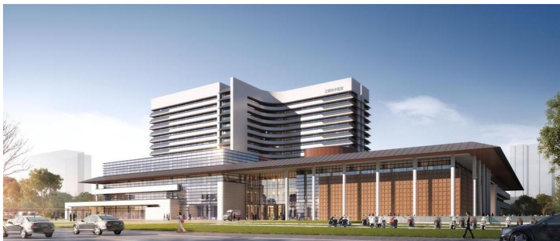
图 1 江阴市中医院新址

新院建设预计将投入 15 亿元, 占地 127 亩, 按照三级甲等中医院标准设计, 规划床位 1000 张, 总建筑面积 18 万 m^2 , 预计 2023 年底搬迁。