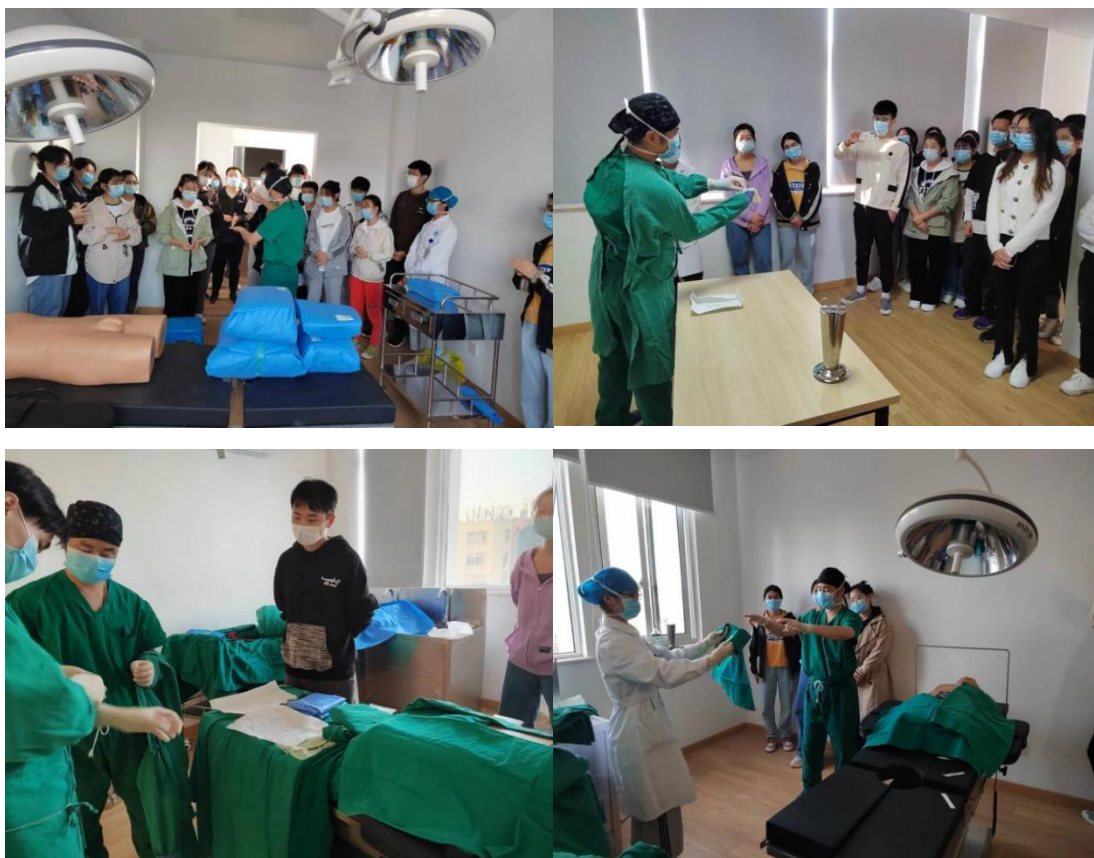
图 17 情景模拟

两个亮点：1、授课老师经过省级系统专科培训并得到资质证书，有授课质量保证；2、通过手术室情景现场还原，让学生对培训有了直观的体验，更能加深细节学习的印象。课后进行的授课质量调查总分 50 分，同学们给予了平均分 47 分的高分，这是对情景模拟授课模式及老师授课质量的肯定。