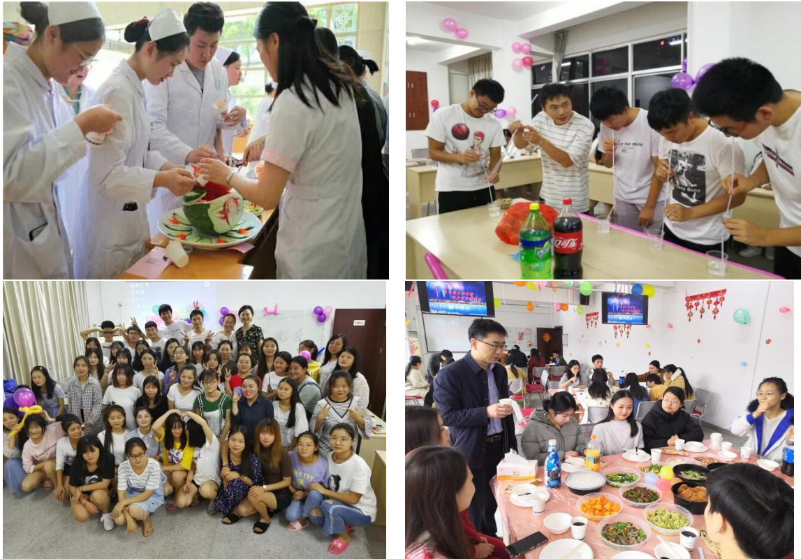
图 22 人文关怀、寓教于乐