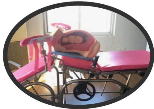
图 16 丰富的教学工具