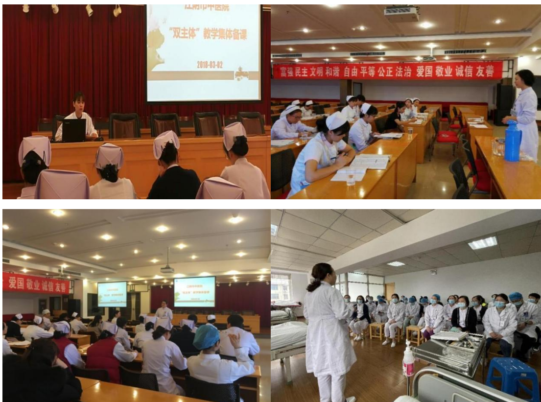
图 12 授课老师集体备课