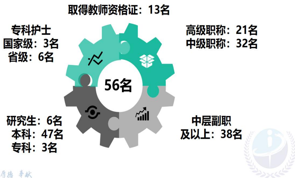
图 10 教学师资力量

交流经验，在教学工作中取得了一定的成效。王雪平老师在无锡市首届临床护理青年教师讲课比赛中获得“二等奖”，徐丹老师获得“三等奖”。医院每年召开科教工作表彰会，对教学工作给予高度认定，对优秀教师给予表彰。