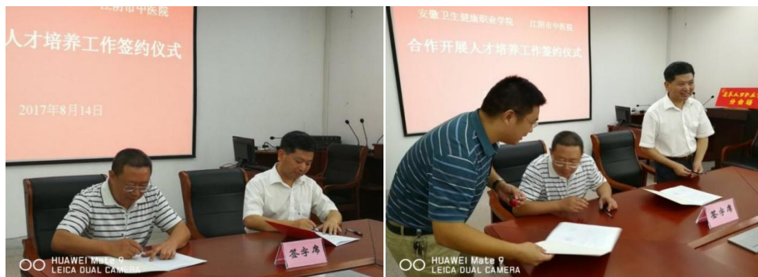
图 2 “双主体”教学签约仪式

多年来江阴市中医院一直承担着安徽卫生健康职业学院护理专业的临床实习带教任务，校院合作可谓源远流长。2017 年 8 月 14 日，双方隆重签约（见图 2），江阴市中医院正式成为安徽卫生健康职业学院（当时的安徽人口学院）护理系教学医院，达成了紧密的合作关系（见图 3、4）。目前，医院全程参与学校人才培养，在医院内改建教室，配备各种教学设施，为学校提供兼职教师，承担专业理论课教学、实践课授课、临床见习、实习带教和管理工作任务等，与学校双主体育人。至今共毕业了 5 届学生（见图 5），现第 6 届 2106 班学生在江阴学习中。6 年共收护理床边班学生 345 人次，其中男生 69 人，女生 276 人。