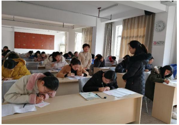
图 20 理论、技能考核