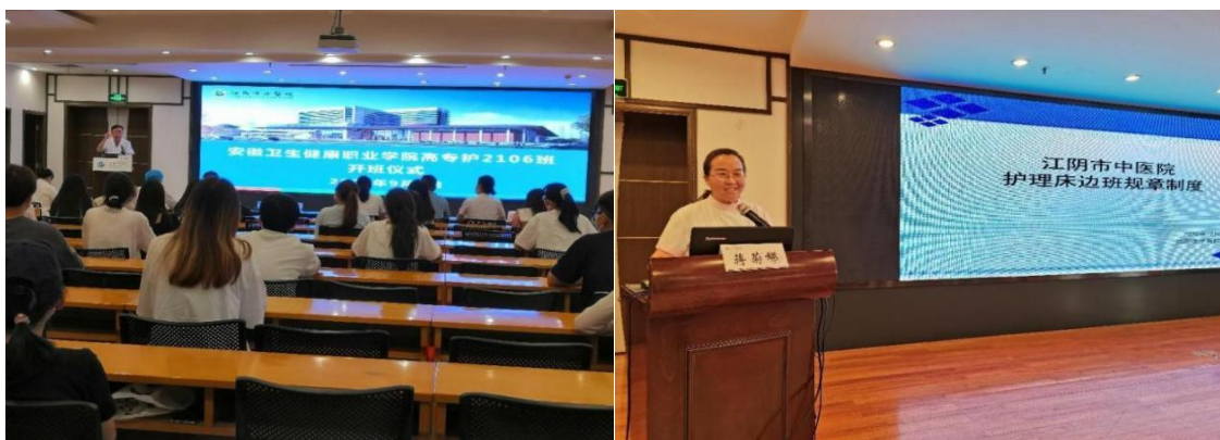
图 11 床边班开班仪式

新学期开始前医院组织召开开学典礼，教学分管院长对教学工作进行全面部署（见图 11）；学期结束有总结讨论，运用质量管理工具对教学质量进行分析；定期组织各课程兼职教师集体备课（见图 12），学校课程负责老师定期到医院进行一对一课程对接（见图 13）。