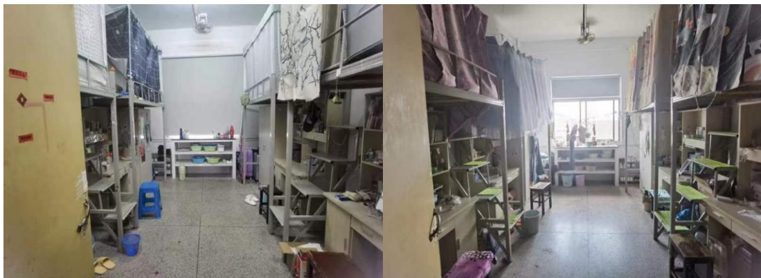
图 27 组织学生宿舍自查，老师抽查，保持住宿环境安全、整洁。