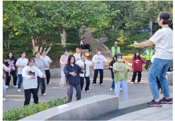
图 21 强身健体，积极锻炼