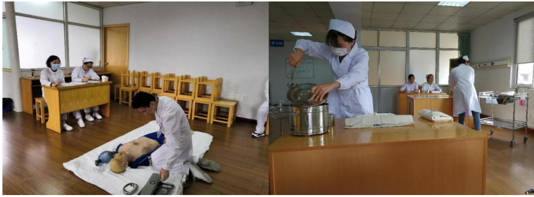
图 29 组织学生技能竞赛，以赛促学