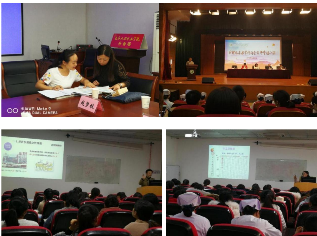
图 14 “双主体老师”一对一课程指导