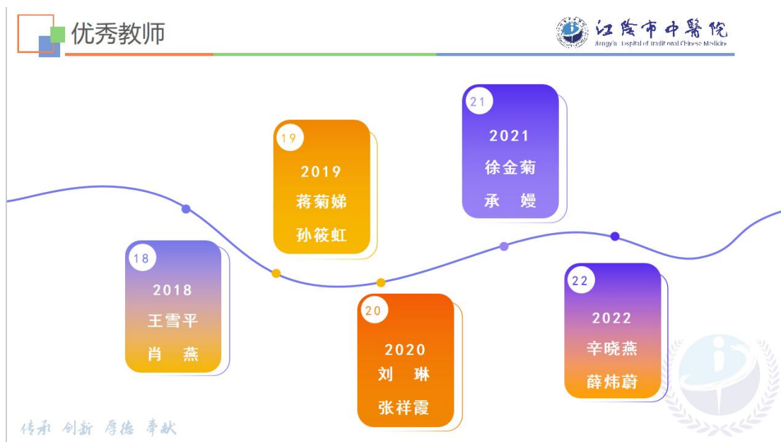
图 30 2018-2022 优秀授课老师

综上所述，有院校领导的关心和大力支持，有政策、制度的强力保障。安徽卫生健康职业学院江阴办班点-江阴市中医院“双主体”护理床边班，在学院“双主体”班中成绩一直名列前茅。