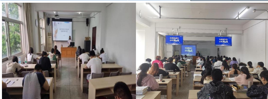
图 6 床边班教室