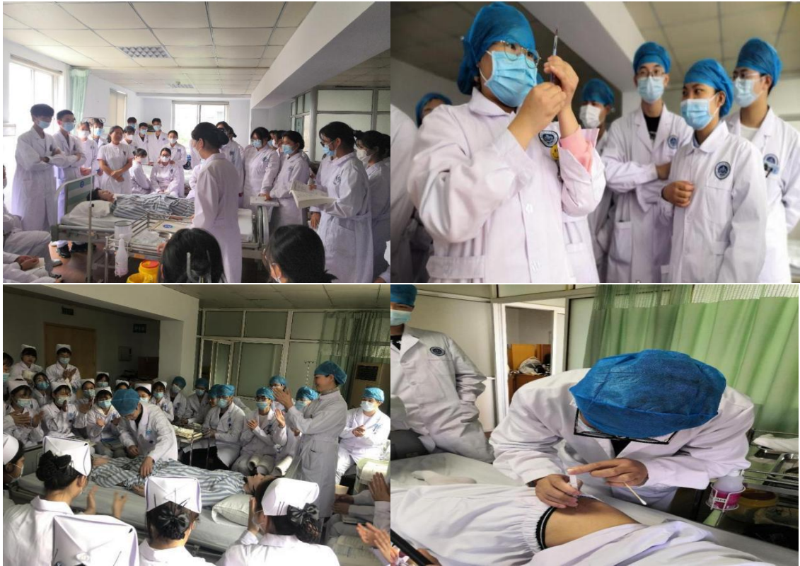
图 18 技能练习