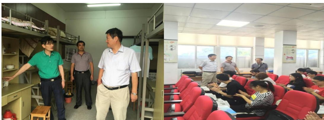
图4 学校领导到医院实地了解学生生活、学习情况