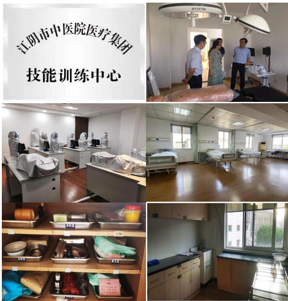
图 7 技能训练中心

2020 年医院耗资 150 余万、占地面积 400 余平方米，成立了临床技能训练中心(见图 7)。实训中心内建有内科、外科、妇科、产科、儿科、急救、护理、腔镜八个技能训练室和一个模拟手术室、一个模拟产房，并配有信息化考场一个。目前可提供心电图判读、心肺听诊、胸穿、骨穿、腹穿、外科打结、妇科检查、产科检查、儿童腰穿、婴儿下肢补液、模拟腔镜、成人和儿童 CPR、气管插管和所有护理技术操作等技能的培训。目的将医学理论教学与标准化病人(SP)相结合，通过临床基本操作模拟训练、急救系统训练、临床综合能力和思维训练、临床手术操作模拟训练、临床综合素质评估体系，培训提升医学生临床实践能力和临床思维能力。