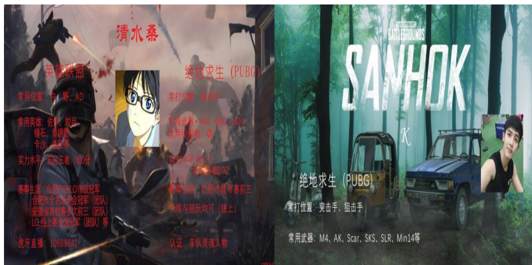
图 17 电竞陪练师介绍

电竞陪练师是近年来电竞产业初步兴起的职业，他们凭借游戏操作的高超水平与趣味性的语言风格使得个人身价高涨。2019 年暑期，安体电竞专业学生自发组织陪练师团队，相互交流与切磋，有专门的训练场地和练习室，下图为学生陪练平台个人宣传图。