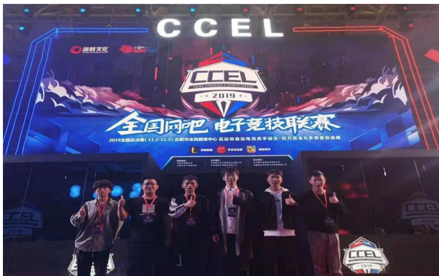
图 12 学生执裁照片

图为电竞专业裁判员学生进行 2019CCEL 全国网吧电子竞技联赛安徽赛区的赛事执裁后的合影。作为进行现场赛事的维护和执裁的裁判员，奋斗在电竞赛事的一线工作者，学生们也同样在在赛场上留下了独特的身影。