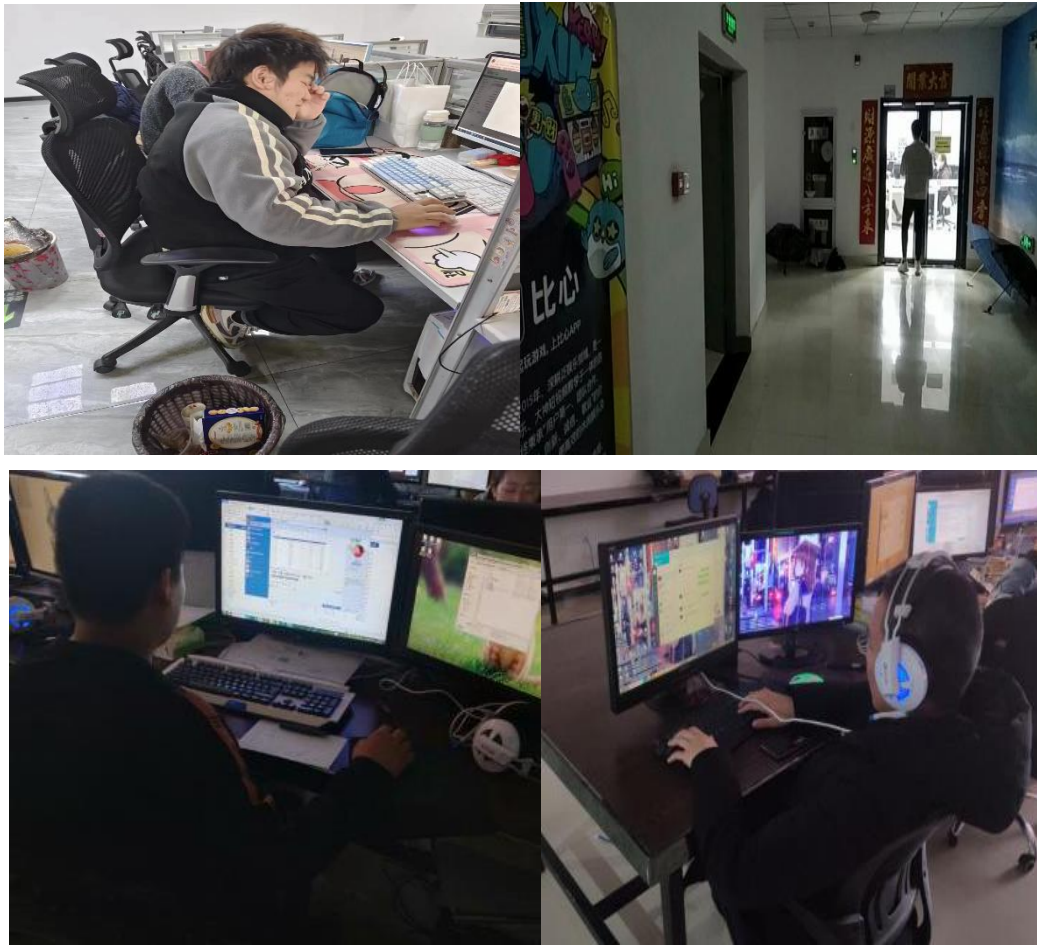
图 23 部分学生实习就业照片