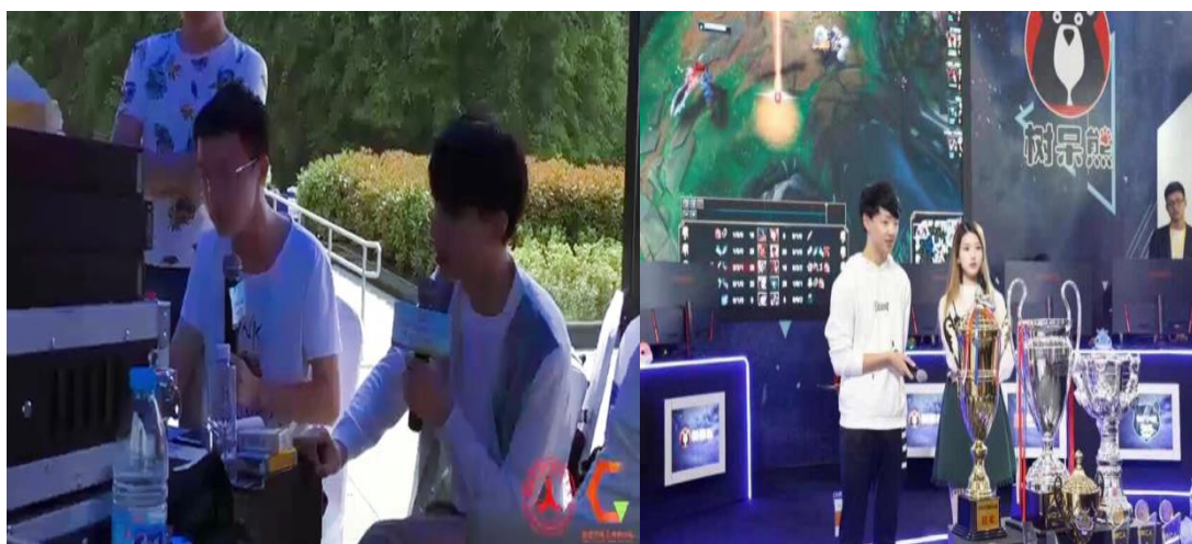
图 9 课外实践

电子竞技专业设有各项理论与实践《电子竞技解说概论》的课程，在课外电竞教师会经常带领学生进行课外赛事解说实践，锻炼学生的各方面能力。图为电竞专业老师带领班上学生进行赛事解说实践性学习，并培养赛事解说团队，在校外为省内各类电竞赛事进行现场解说。