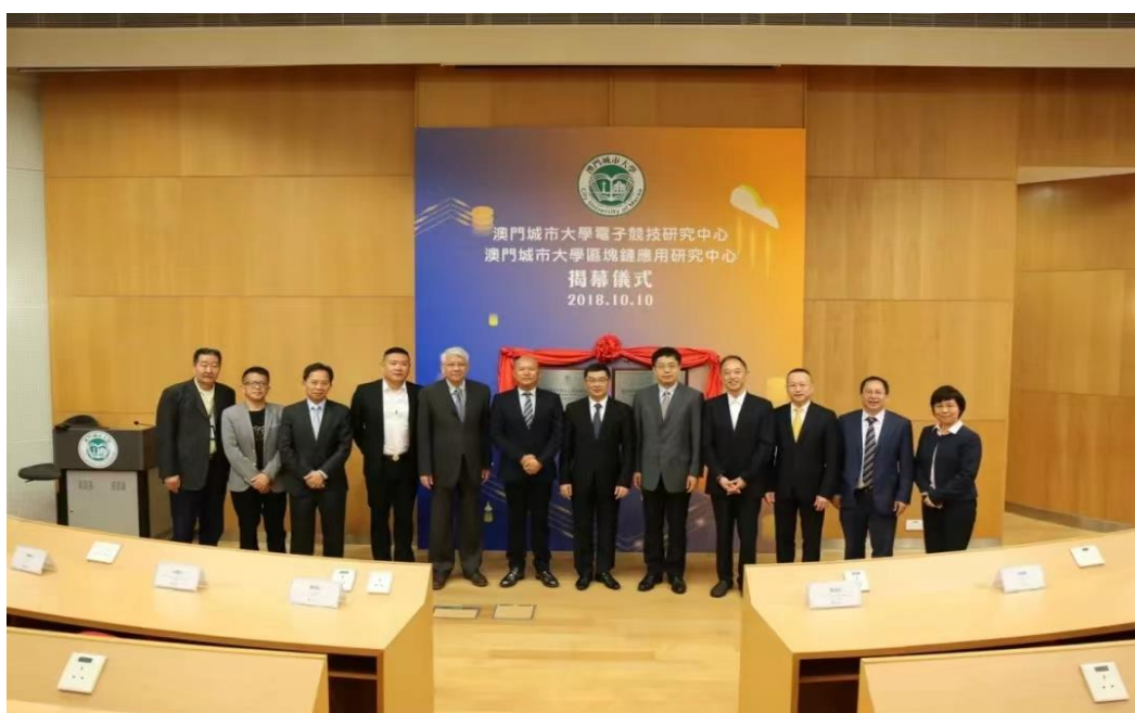
图 3 澳门城市大学电子竞技研究中心与区块链研究中心揭牌仪式