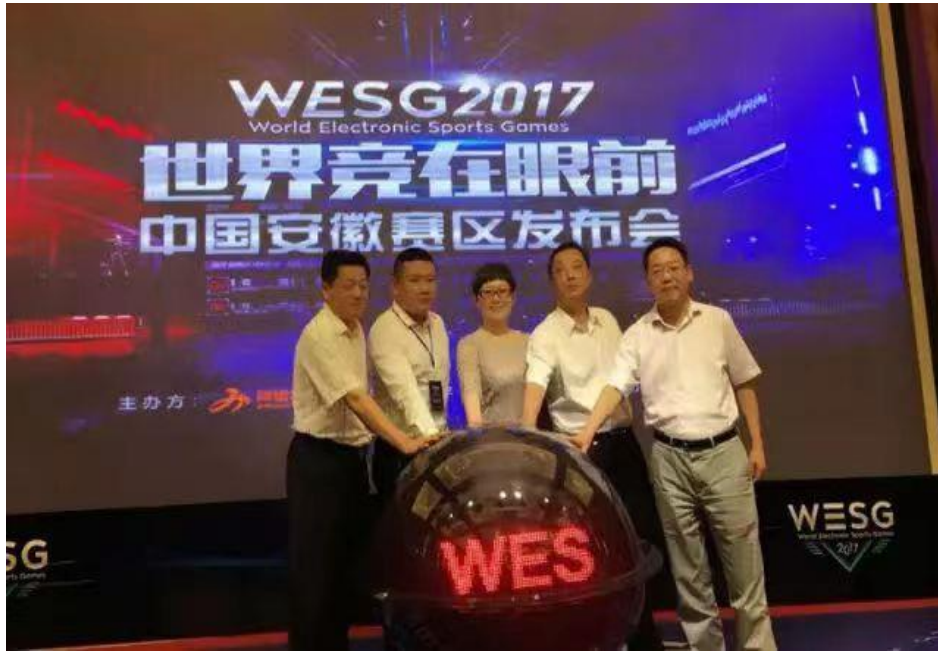
图 4 WESG 中国安徽赛区发布会