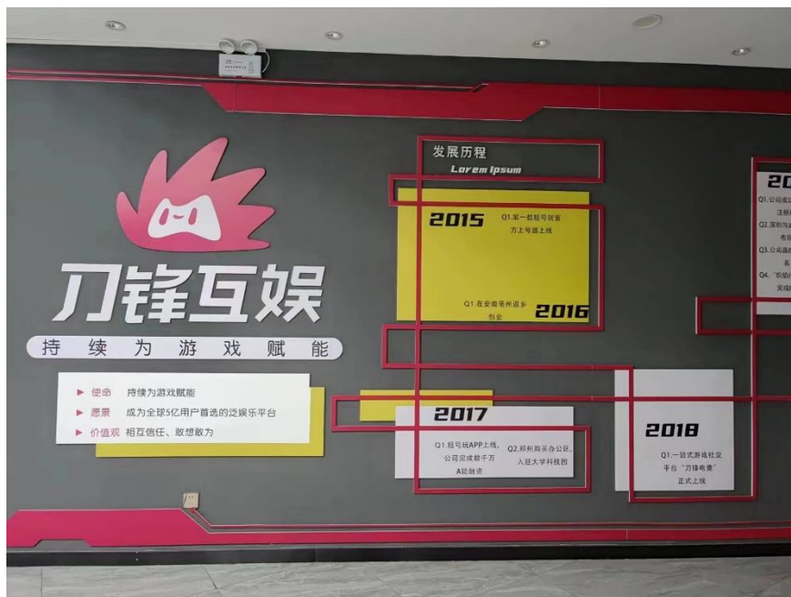
图 21 刀锋互娱

企业有着深度合作，保障学生的实习与就业，如北大青鸟集团，复星电竞，北京一下科技，阿里体育有限公司，厦门海沧教育发展有限公司，上海比心网络科技有限公司，合肥光之羽文化传播有限公司等等。仅刀锋互娱公司电竞相关岗位每年就可接收 200 名实习生。