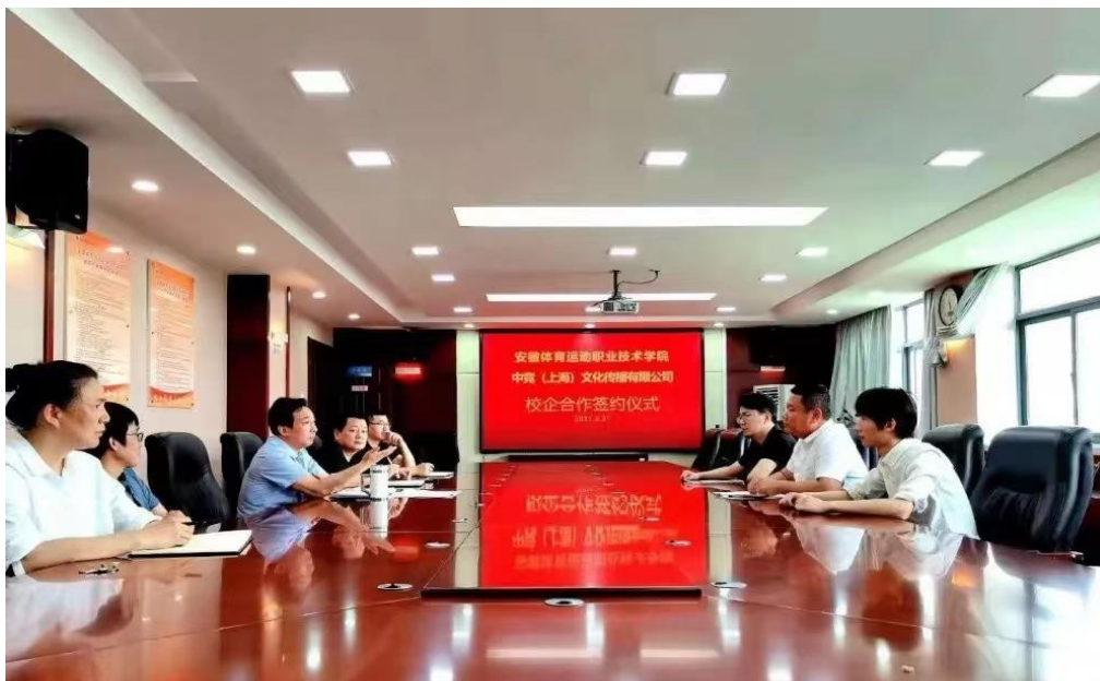
图 7 校企合作签约仪式

校企双方合作内容包含：专业建设、课程建设、教材建设、师资队伍建设、实习实训、创新创业、就业指导等方面。