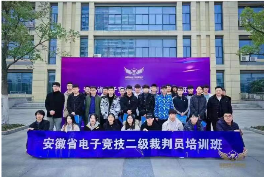
图 11 电子竞技裁判员培训