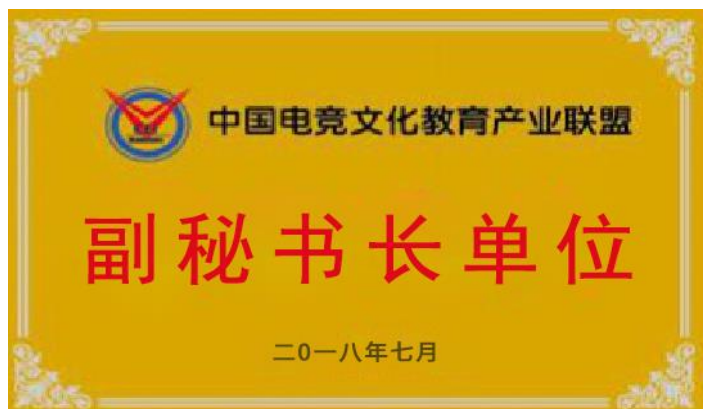
图 2 中国电竞文化产业联盟授牌