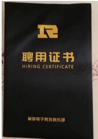
图 19 RNG 俱乐部聘书