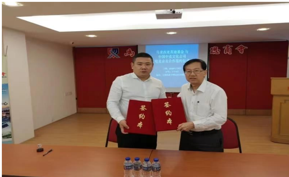
图 5 合作签约仪式