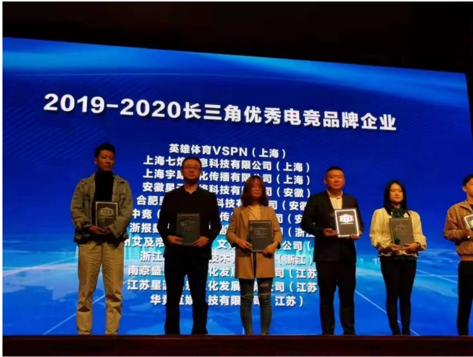
图 6 长三角优秀电竞企业获奖仪式