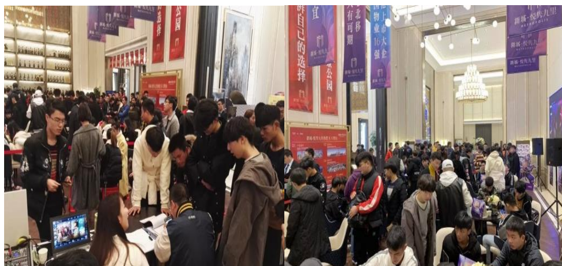
图 10 组织观赛

课堂之外，电子竞技运动与管理专业学生还进行了多次省内观赛活动。除此之外，为检验教学成果，培养学生组织赛事与解说赛事等能力，电竞班全体师生会组织并参加电子竞技赛事，所有工作人员（如赛事策划员、裁判员、临检员、记录员等）均由师生担任。18年、19年均举办了安体电子竞技比赛，比赛项目为英雄联盟，平均每次比赛有十五支队伍参加，参赛人数达到80人，学生积极维护现场赛事秩序，有条不紊地安排赛事进程，在实际练习中获得了很多有关赛事举办过程中的技能与经验，为将来走上电竞工作岗位打下基础。