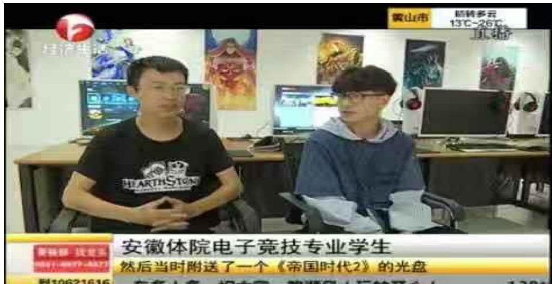
图 14 安徽经济频道采访

2018年中竞合办电竞专业被安徽省经济频道采访，重点表扬安体电竞专业的建设给行业起了模范作用。