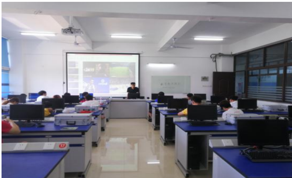
图 20 实习学生教学现场

实践教学等实训(实习)是教学计划的一项重要环节，实践教学是巩固理论知识，加深理论认识的有效途径，是理论联系实际、培养学生掌握科学方法和提高动手能力的重要平台。有利于学生素养的提高和正确价值观的形成。下图为 17 级电竞专业学生实习作为电竞讲师在厦门南洋学院进行授课的课堂。经过两年多的学习与锻炼，学生能够游刃有余地为新一代学生们讲授电竞知识，在教学的过程中自己也在不断磨练与提升。