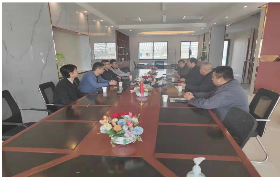
图 8 校企合作招生座谈