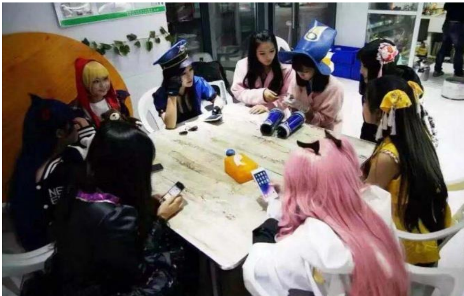
图 16 COSPLAY 表演活动候场

电竞专业学生在校期间从事电竞游戏直播，有两到三年直播经验，拥有个人直播室和固定粉丝群体，线下承接安徽省内活动主持和各大电竞赛事线上解说。