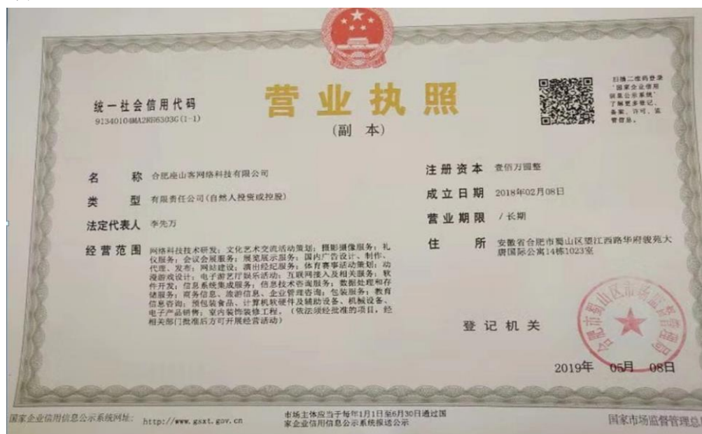
图 18 营业执照

下图为安徽体育运动职业技术学院 17 级电子竞技运动与管理专业学生在 2019 年大二在读期间成立的电竞文化广告传播推广公司的营业执照。公司内部包括电竞主播、电竞解说、电竞陪练师、电竞赛事运营及广告物料设计制作等多项业务。