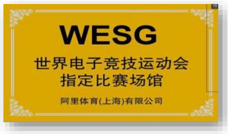
图 1 WESG 指定比赛场地授牌

注：2018 年中竞（上海）文化传播有限公司成为中国电竞文化产业联盟副秘书长单位