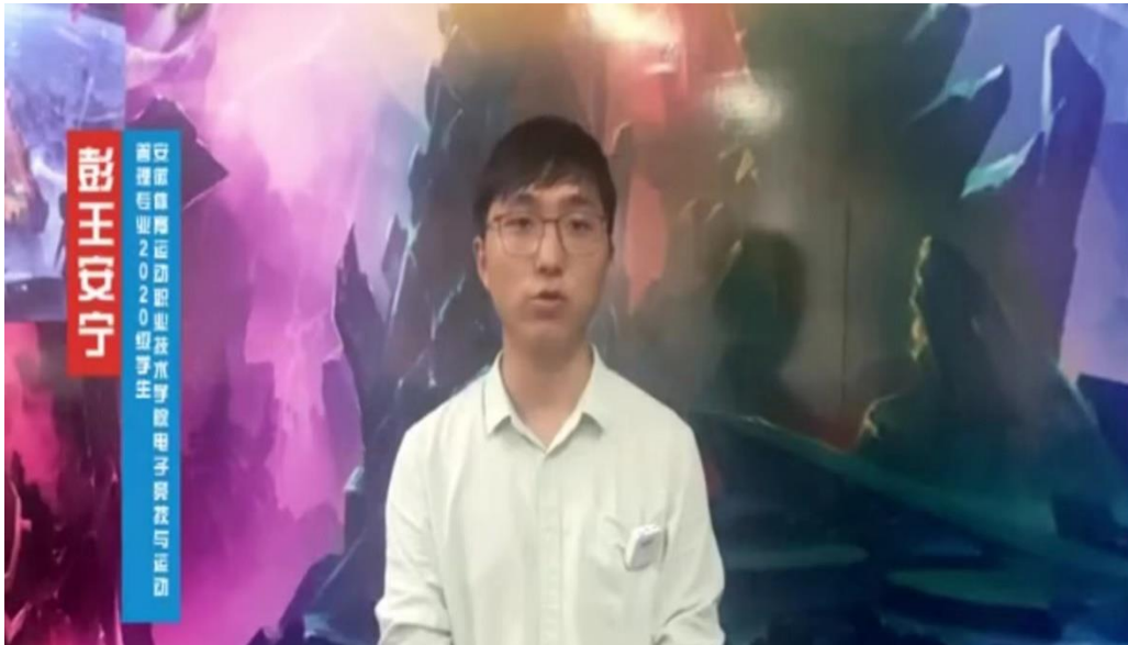
图 15 工人日报采访