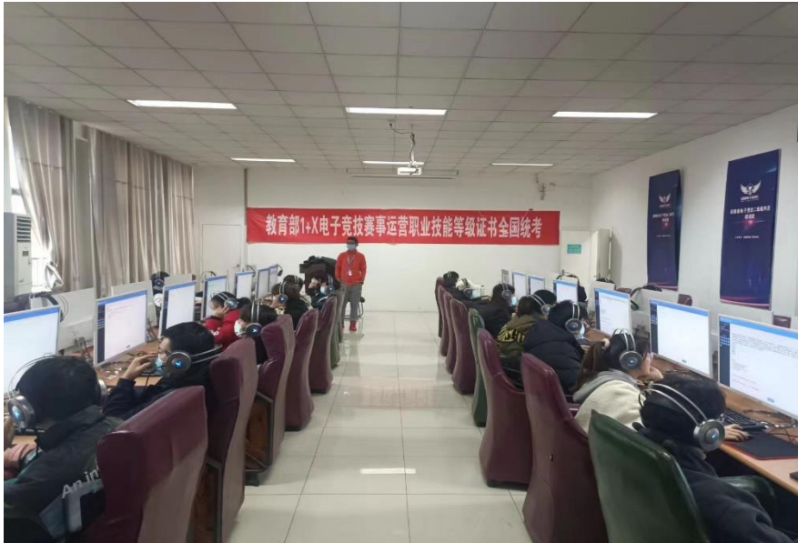
图 13 1+X 证书考试