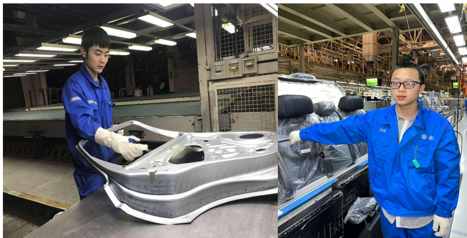
图 2 2021 年 8 月学院第一批 2019 级学生进入大众