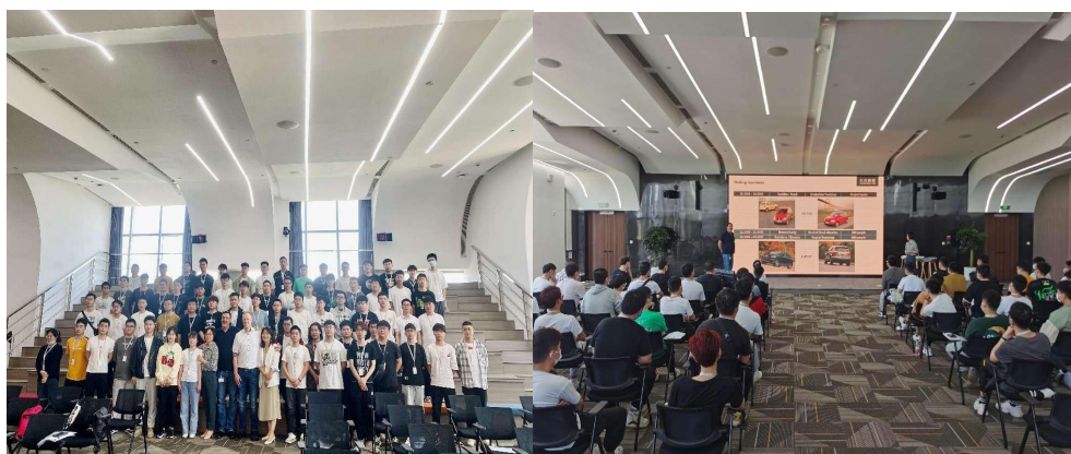
图 6 2022 年 7 月学院第一批 2019 级学生参加大众汽车入职培训