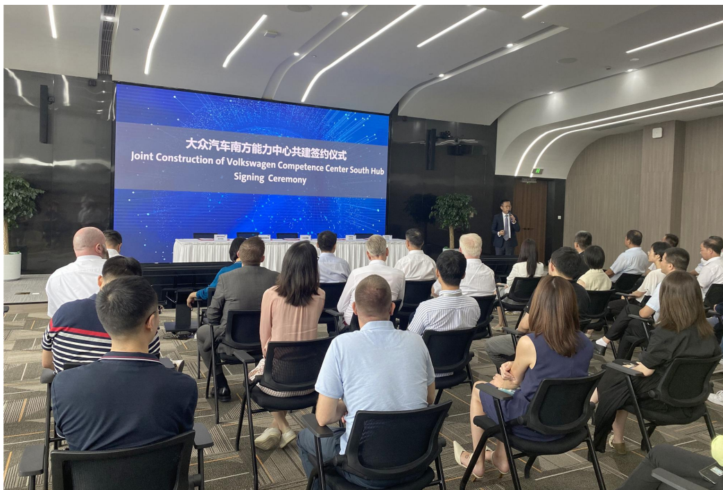
图 1 2021 年 7 月 16 日大众汽车南方能力中心签约仪式

2021 年 7 月，在合肥市设立“大众汽车南方能力中心”签约仪式在大众汽车（安徽）有限公司举行，我校作为承接该中心项目建设的主要合作院校，通过签约正式参加到该中心的共建项目当中。