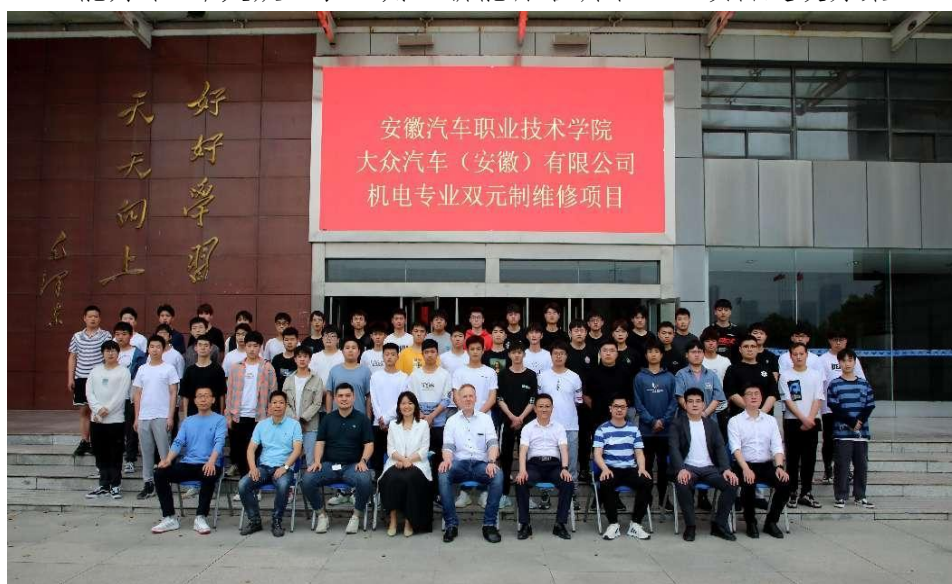
图 4 2022 年 4 月学院与大众汽车“双元制维修项目”正式开班