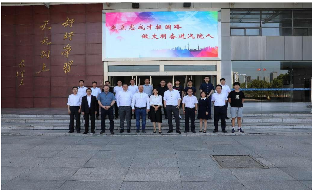
图 5 2022 年 6 月学院与大众汽车“双元制维修项目”教学团队合影